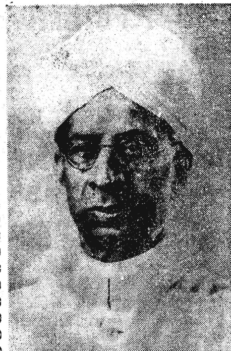
Wiceprezydent Republiki Indii dr Sarwapalli Radhakrisznan.

W porcie lotniczym na Okęcie, przybranych flagami o barwach narodowych Indii i Polski oraz transparentami głoszącymi przyjaźń między obu narodami, zebrały się liczne rzesze mieszkańców stolicy, by serdecznie powitać dostojnego gościa.