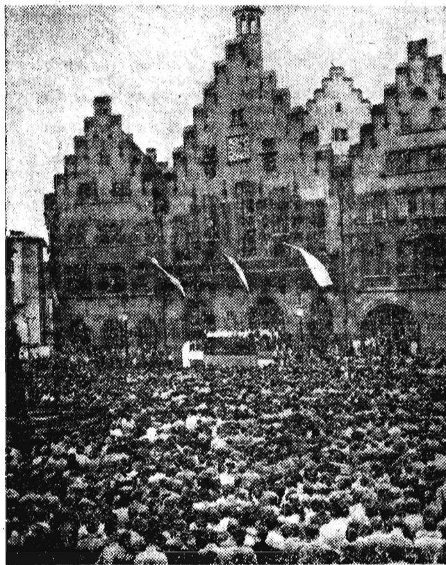
Na wiece w Frankfurtu nad Menem poseł do Bundestagu z ramienia CDU, prof. dr Ferdinand Friedensburg domagał się zacieśnienia stosunków ze Związkiem Radzieckim. Wiece zgromadziło ponad 8.000 osób.