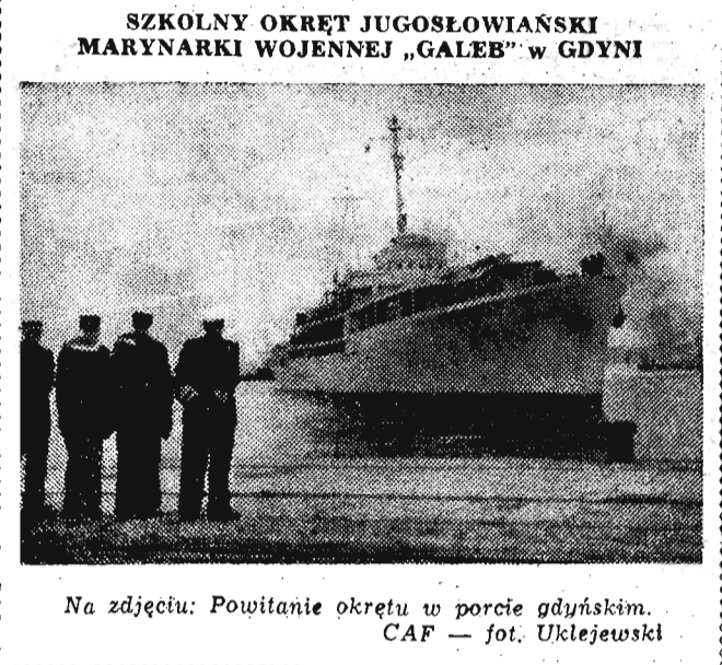
SZKOLNY OKRĘT JUGOSŁOWIAŃSKI MARYNARKI WOJENNEJ „GALEB” w GDYNI