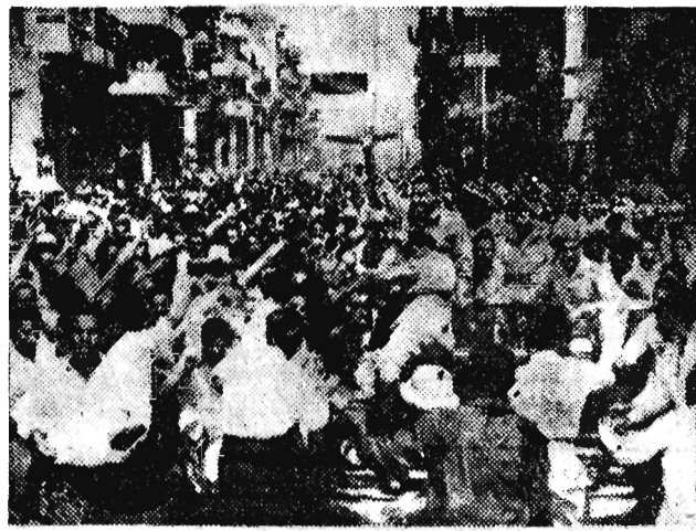
Na zdjęciu: Owacje ludności na cześć Nassera w Port - Said.