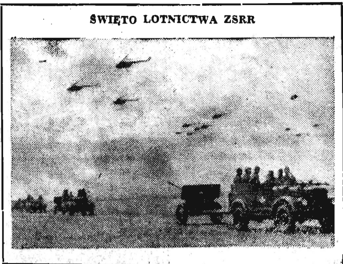
ŚWIĘTO LOTNICTWA ZSRR

Nr 152 (2191) — Rzeszów, 27 czerwca 1956 r. Cena 20 gr