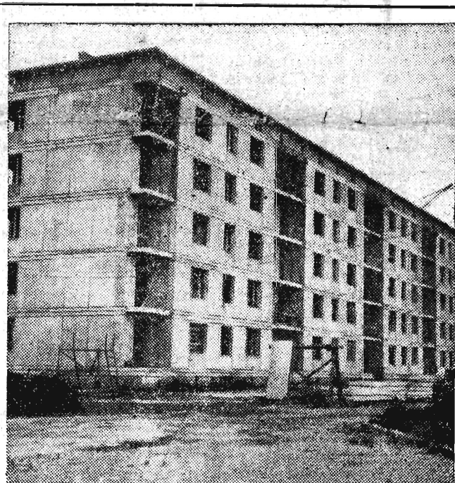
Na osiedlu Wierzbno w Warszawie ukończono w stanie surowym budowę dwu bloków mieszkanowych wznoszonych metodą przemysłową. Na zdjęciu: Pierwszy ukończony budynek na osiedlu Wierzbno.

Prezes Rady Ministrów mianował ob. Irene Strzelecką podsekretarzem stanu w Ministerstwie Kontroli Państwowej. (PAP)