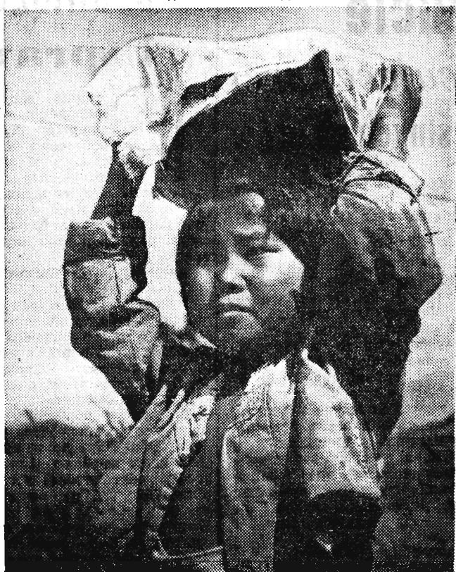
Na zdjęciu: „Do piekarza”

Z WYSTAWY „KOREA, KRAJ I LUDZIE” OTWARTEJ W DNIU 8 bm. W PALACU KULTURY I NAUKI W WARSZAWIE