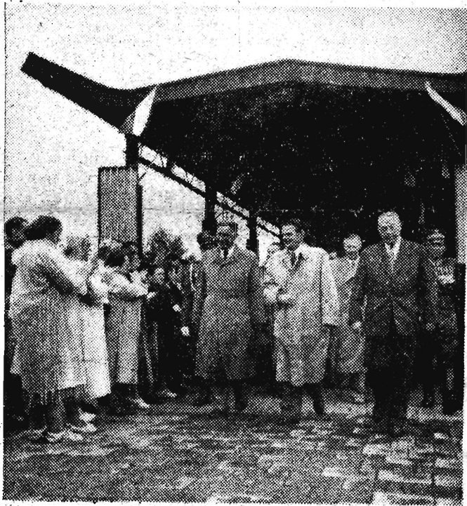
Na zdjęciu: Powitanie gości czechosłowackich na Dworcu Głównym w Warszawie.