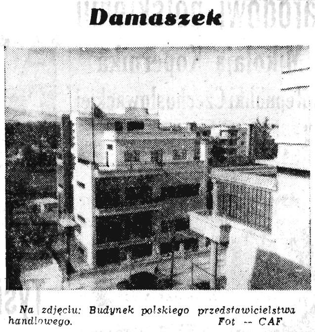
Na zdjęciu: Budynek polskiego przedstawicielstwa handlowego.

PARYŻ (PAP). Po długim okresie chłódów i deszczów zapanała we Francji fala upałów. Temperatura w Paryżu wynosiła w poniedziałek 30 st. w cieniu. Najwyższą temperaturę zanotowano w Monte Limar 34 st. Pobite zostały wszystkie rekordy z ubiegłego roku.