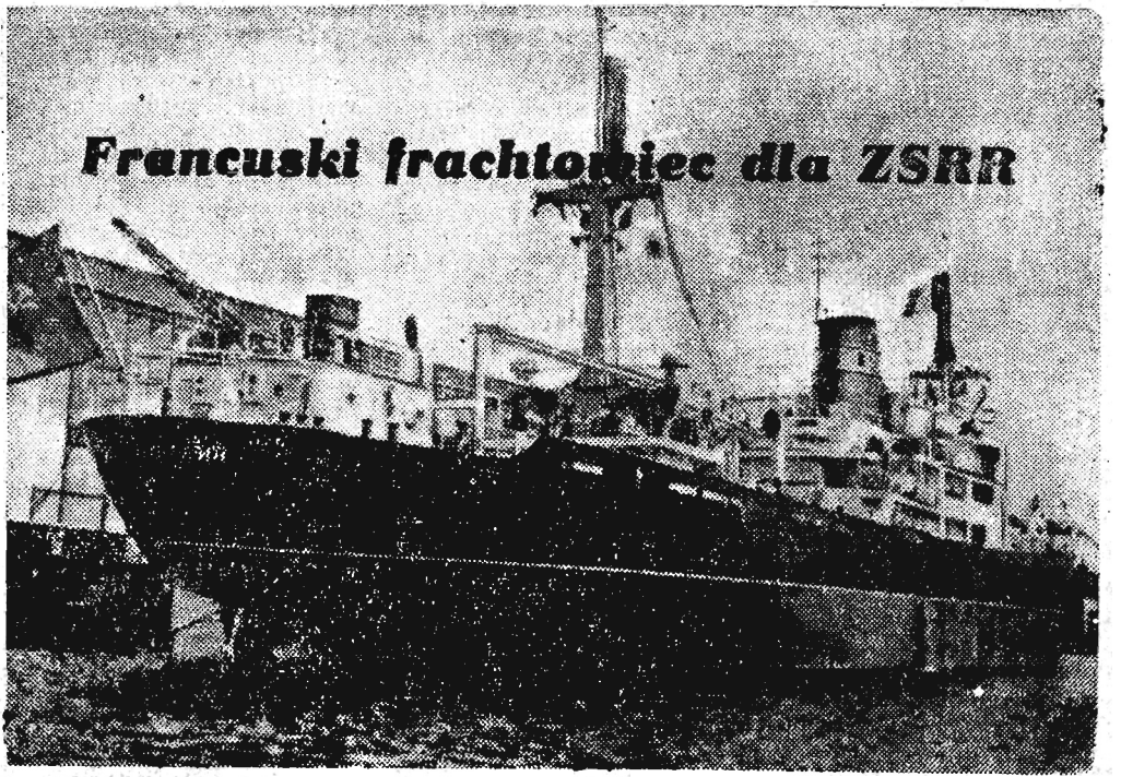
„Siergiej Botkin” jest pierwszym z sześciu frachtowców zamówionych przez ZSRR we Francji.

Na zdjęciu: Statek o wyporności 11.000 ton w porcie St. Nazaire.