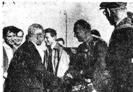
Na zdjęciu: Powitanie turystów na dworcu rzeszowskim.

JAK już informowaliśmy przybyła do Rzeszowa 16-osobowa grupa turystów czeskich i radzieckich. Turyści biorą udział w III Okręgowym Raidzie Przyjaźni w Bieszczadach, który rozpoczął się w niedzielę tj. 2 bm.