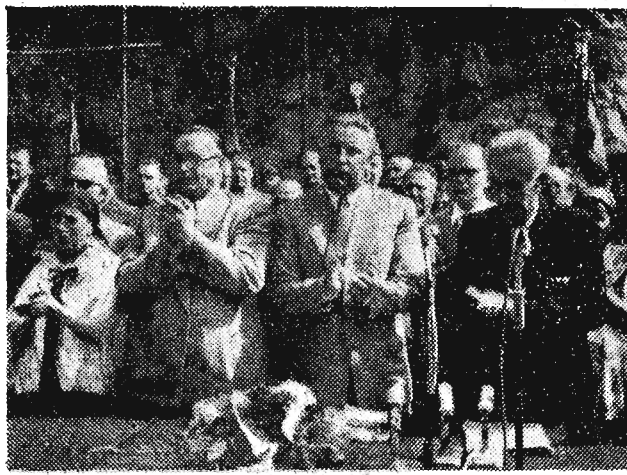
U stóp monumentalnego Pomnika Czynu Powstańczego na Górze św. Anny odbyły się uroczystości poświęcone 35 rocznicy wybuchu III Powstania Śląskiego.

Nr 212 (2251) — Rzeszów, środa 5 września 1956 r.