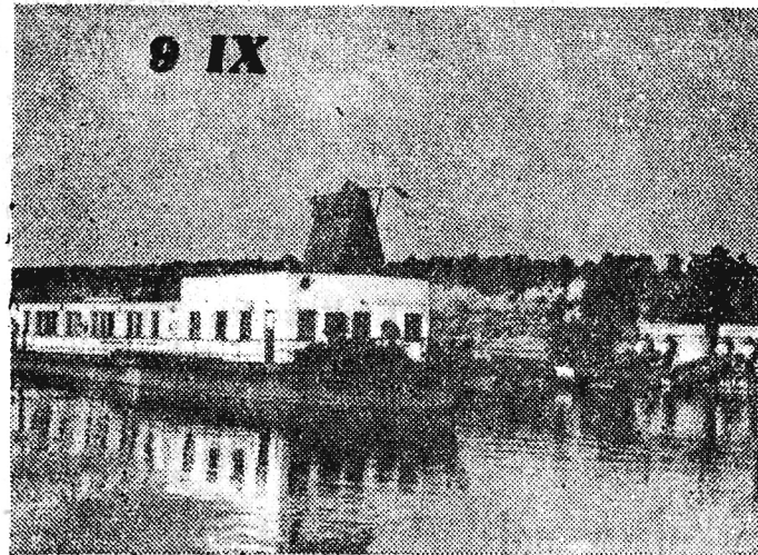
Na zdjęciu: System nawadniający w pobliżu wsi Brzslan w okolicy Ruse.