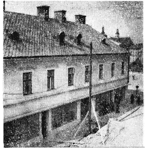
...a tak będą wyglądać fasady kamienic i sklepów po zakończeniu robot.