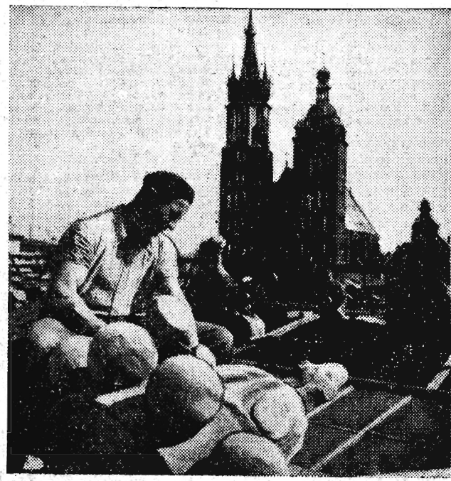
Na zdjęciu: Zniszczone rzeźby attyki są uzupełniane przez kamieniarzy Pracowni Konserwacji Zabytków.