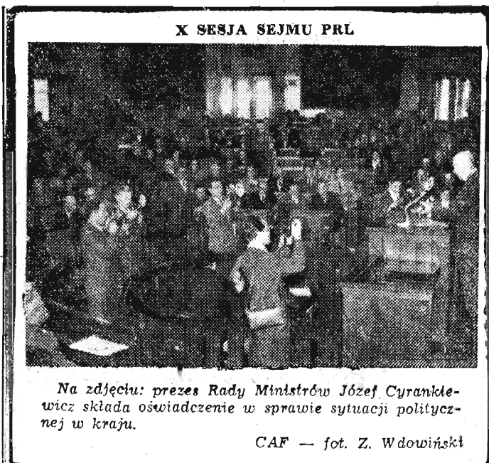
Na zdjęciu: prezes Rady Ministrów Józef Cyrankiewicz składa oświadczenie w sprawie sytuacji politycznej w kraju.

Towarzysze i obywatele! Nie uciekajcie się do wyrzeczeń. Rewidujcie plany produkcji i plany obniżenia kosztów w swoich zakładach pracy. Zgłaszajcie dodatkowe wpłaty przedsiębiorstw do budżetu państwa. (PAP)