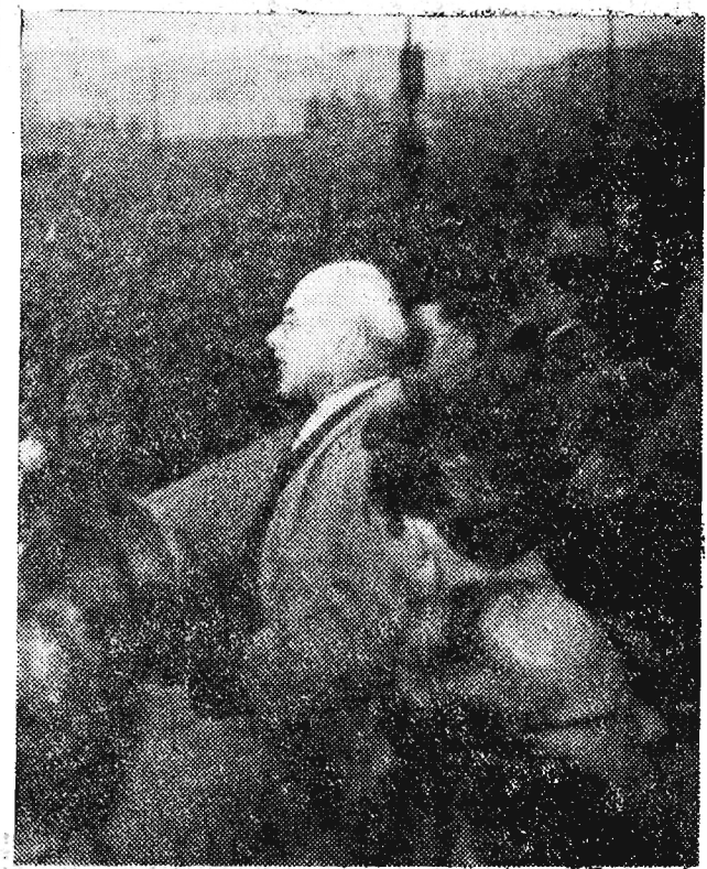
Do wielotysięcznych tłumów zgromadzonych na wiece przemawiał I sekretarz KC PZPR Władysław Gomułka.

24. X. 1956 r. na Placu Defilad przed Pałacem Kultury i Nauki w Warszawie odbyło się ogólnowarszawskie zgromadzenie ludzi pracy.