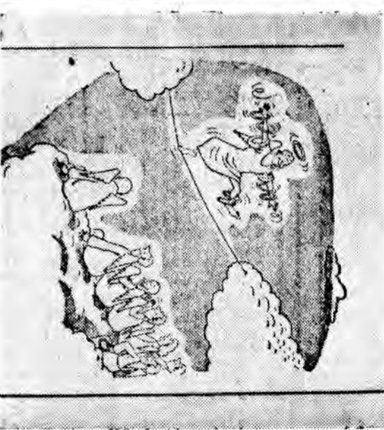
— Teraz przynajmniej czas się mniej dłuży!