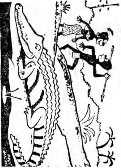
— Jak dobrze sprzedasz skórę, to mi kupisz torbę z plastiku...

Podobnie jak w latach ubie-... Konkurs „Turysty”... ROZWIĄZANIA I NAGRODY