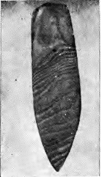
Siekierka z kamienia asardzkiego sprzed 5 tys. lat