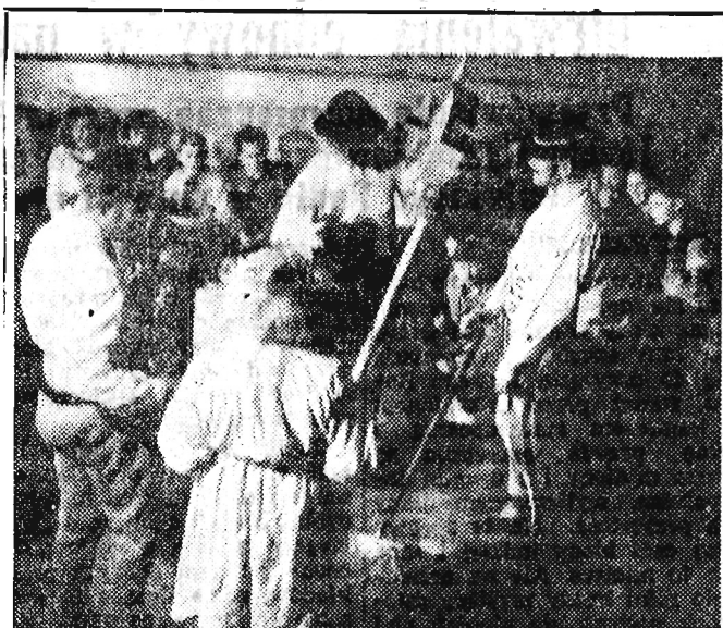
Dzieci z Węgier przebywające w Ośrodku Pocztowców na Cyrli w Zakopanem odwiedził w wigilii święty Mikołaj i góralscy kolednicy.