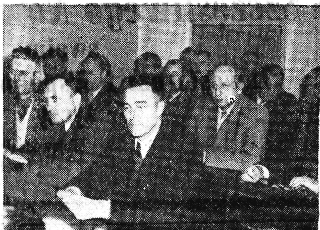
Na zdjęciu: Kursanci na sali wykładowej.

W celu bliższego zaznajomienia wszystkich dyrektorów zespołów PGR z zagadnieniami rozrachunkowo-gospodarczymi (zostaje wprowadzony we wszystkich gospodarstwach z dniem 1 stycznia 1957 r.) z zadaniami samorządu robotniczego oraz projektem nowego układu zbiorowego prowadzi się w Ośrodku Szkoleniowym PGR w Palentach pod Warszawą 6-dniowe kurso-konferencje. Do chwili obecnej przeszkolenie to przeszło ponad 300 dyrektorów zespołów.