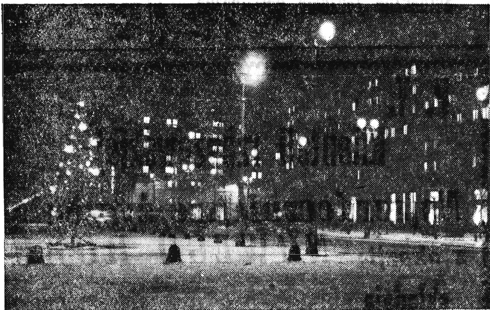
Na Placu Konstytucji w Warszawie CAF — fot. Miedza