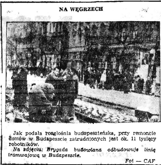
NA WĘGRZECH Jak podała rozgłośnia budapeszteńska, przy remoncie domów w Budapeszcie zatrudnionych jest ok. 11 tysięcy robotników. Na zdjęciu: Brygada budowlana odbudowuje linię tramwajową w Budapeszcie.

Zyczę wam — powiedział w zakończeniu min. Spychalski, waszym rodzinom i bliskim dużo pomyślności w nadchodzącym roku. Dla żołnierza wyróżnieniem i zasługą jest świadomość dobrze spełnionego obowiązku żołnierskiego. Życzymy więc wzajemnie sobie jak najlepszego wykonania naszych zadań wojskowych.