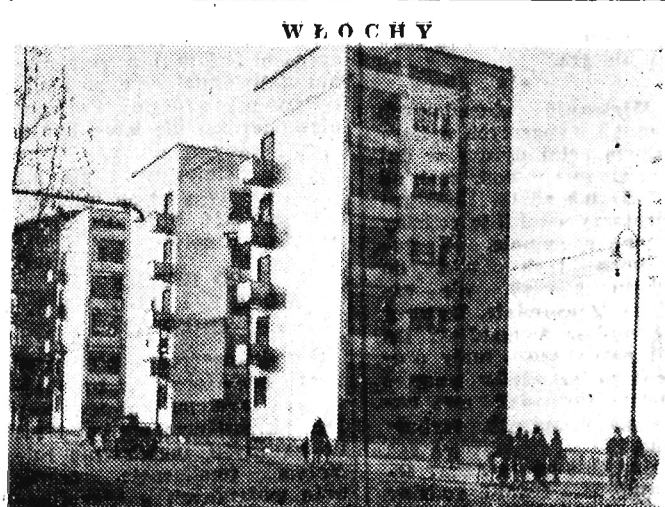
Na zdjęciu: Mediolan — bloki mieszkaniowe.

Drugie zjawisko to trwające od dawna rozbieżności między rządem a kierownictwem armii, której trzon stanowią zawodowi oficerowie, wyszkoleni na wzorach holenderskich. Trzecim zjawiskiem jest panująca wśród ludności Sumatry niezadowoloność z braków i poważnych niedociągnięć działalności miejscowej administracji, z przewagą korupcji i niedołęstwa.