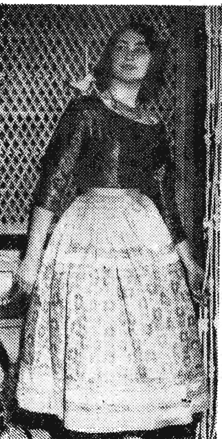
Młoda Włoszka — w stroju wieciorowym (brokat i jedwab).