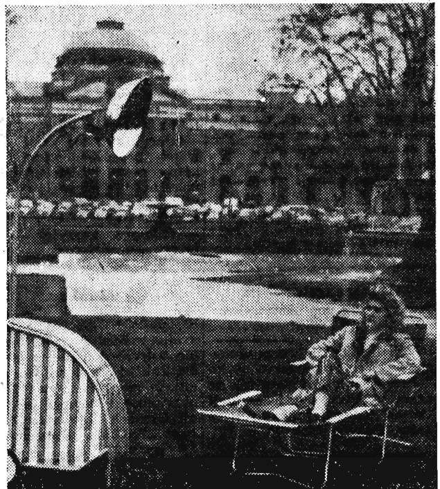
Młoda dama czuje się świetnie na składanym przenośnym campingowym leżaku podczas nasświetlania promieniami podczerwonymi. Energii cieplnej dostarcza butan z metalowej butli schowanej w koszyku, stanowiącym podstawę całego aparatu. Wynalazek ten, przeznaczony specjalnie do użytku wycieczkowiczów, zademonstrowano na specjalnej wystawie turystyczno-sportowej w Wiesbaden. (NRF). CAF