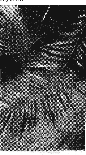
A palmy dobrze rosną na gościnniej polskiej ziemi. Wielkie zielone liście wyciągnęły ku przyświecającemu przez szybę słońcu. Być może tęsknią za słoneczną, ojcuzną...