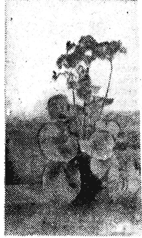
Na bezrybiu i rak rybą. Podobnie jest z kwiatem prymuli. Jak nie ma ładniejszych i ona się podoba. Właśnie prymula w „całej krasie” widoczna jest na zdjęciu.

Wiosną poświęcono już sporo słów. Nasz fotoreporter uparł się dostarczyć „na macanym” dowód, że wiosna już przyszła. Wróciłby z niczym - niestety - gdyby nie przyszło mu na myśl wstąpić do ogrodów rzeszowskich. Tu było wkoło zielono, wiosennie... Tużko. że tu cały rok jest zielono.