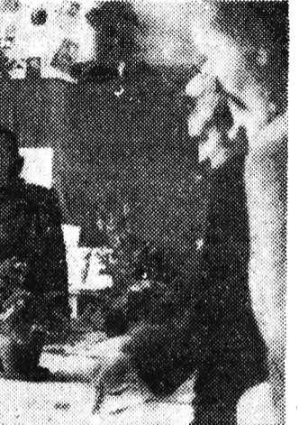
...prace konkursowe zyskały uznanie!

Niedawno w Szkole nr 3 w Rzeszowie przy ul. Hoffmanowej odbyła się uroczystość - podsumowanie wyników „V. konkursu czytelniczego.”