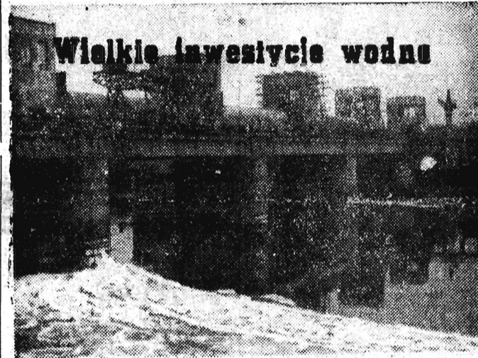
Wielkie inwestycje wodne

WARSZAWA (PAP). Rządy polski i francuski dokonały w ostatnich dniach wymiany not, w których obie strony w trosce o poprawę stosunków polsko-francuskich, wyrażają życzenie ułatwienia ruchu osobowego między Polską i Francją. W tym celu władze polskie będą nadal ułatwiać, poprzez wydawanie niezbędnych dokumentów, wyjazdy osób pochodzenia francuskiego zamieszkałych w Polsce, a udających się do rodzin we Francji. Władze francuskie podjęły ze swej strony decyzję wydawania przy wyjeździe wiz powrotnych Polakom zamieszkałym we Francji, udającym się w odwiedziny do Polski.