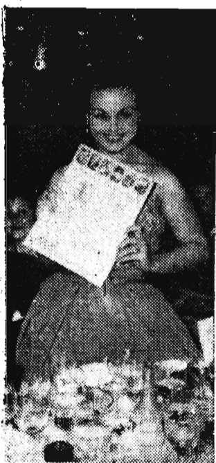
Uroczą aktorkę hiszpańską Carmen Sevilla otrzymała nagrodę za najlepszą rolę (w filmie „La fierecilla domada”).