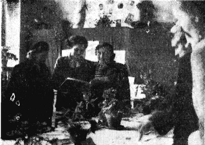
...prace konkursowe zyskały uznanie!