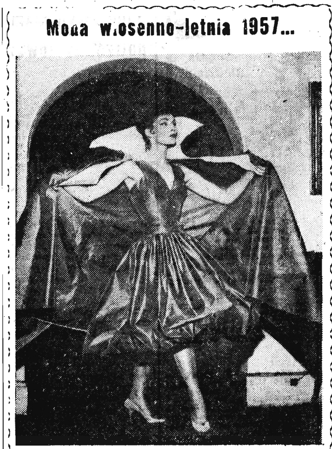
Moja w.osenno-letnia 1957...

To są, oczywiście, tylko niektóre zagadnienia. Na pewno wyniknie jeszcze niemało innych wotczyne. Wszystko to ukazuje nam aktualne zadania organizacji partyjnych na wsi; zmiany, jakie dokonały się po VIII Plenum, wcale nie zwalniają ich od odpowiedzialności za realizację nowego programu działania na wsi, a przeciwnie, odpowiedzialność tę pogłębiają. Oczywiście, konieczne są nowe metody pracy. Będą one kształtować się w toku pracy, w toku współdziałania z kółkami LZS, z radami nadodowymi i samorządem chłopskim. Inna niż dotychczas ry-