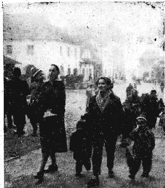
W „Dome Pracy Twórczej Architektów” w Kazimierzu n/Wisłą gości 47-osobowa grupa żon i dzieci architektów węgierskich przybyła na zaproszenie SARP na 3-miesięczny wypoczynek. Na zdjęciu: Spacer po Kazimierzu...