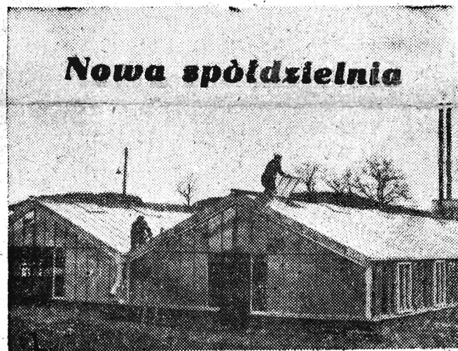
Nowa spółdzielnia w Cieplacach (woj. wrocławskie) powstała po rozwiązaniu starej. Założyli ją 15 członków. Nowi gospodarze przejęli budynki gospodarcze po starej spółdzielni m. in. niewykończoną szklarnię. Spółdzielnia ta wraz z czynną już starą cieplarnią przyniesie spółdzielcom w bieżącym roku około 400 tysięcy zł zysku.