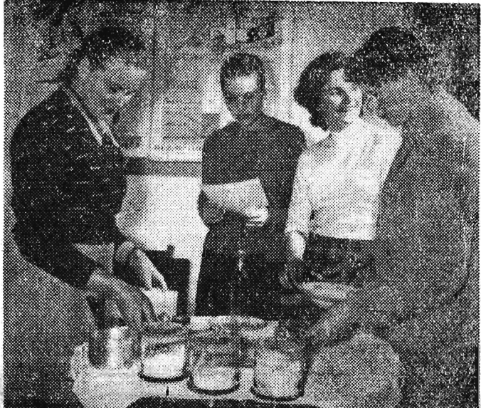
Przy obwodowej przychodni zdrowia przy ul. Konwiktorskiej w Warszawie, istnieje ciekawą się dużym zainteresowaniem „szkoła matek”. Na zdjęciu: uczestniczki kursu w czasie ćwiczeń, których tematem jest przygotowanie pokarmu dla niemowlęcia.

Zgodnie z postanowieniami narady zjednoczeniowej ZRM i ZMR oraz II Plenum TKC ZMS, zjazd uchwał deklarację ideowo-polityczną i statut ZMS oraz wybierze władze centralne, a więc zakończy okres tymczasowości w Związku. Równocześnie Zjazd Konstytucyjny zadecyduje o zwołaniu Kongresu ZMS w takim terminie, by na swój Kongres statutowy Związek Młodzieży Socjalistycznej mógł przyjąć nie tylko z zamierzeniami, lecz również z dorobkiem praktycznej działalności.