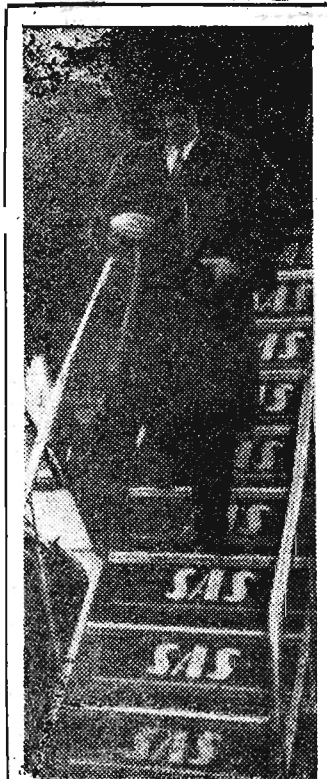
18 IV 1957 r. na lotnisku Okęcie wylądował pierwszy samolot Skandynawskich Linii Lotniczych „SAS” inaugurując systematyczną komunikację lotniczą między Warszawą a Kopenhagą przez samoloty tego towarzystwa. Na zdjęciu: W chwili po wylądowaniu samolotu na lotnisku Okęcie...