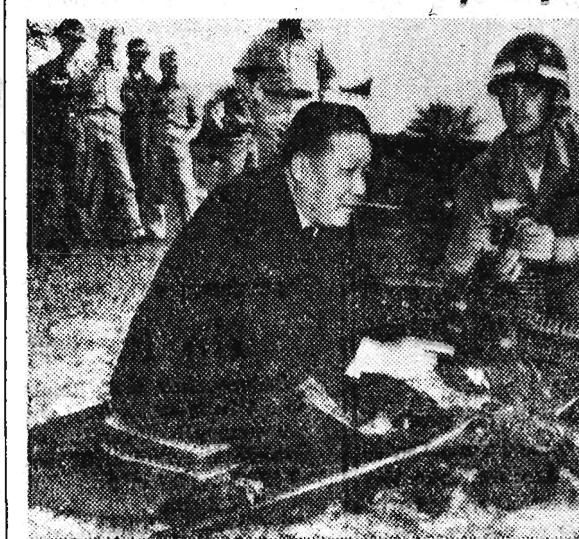
Minister „obrony” Korei Południowej Kim Yong Woo przy lekkim karabinie maszynowym podczas swej wizyty w Ft. Benning w stanie Georgia (USA), gdzie zaznajomił się ze szkoleniem i bronią piechoty amerykańskiej. CAF.