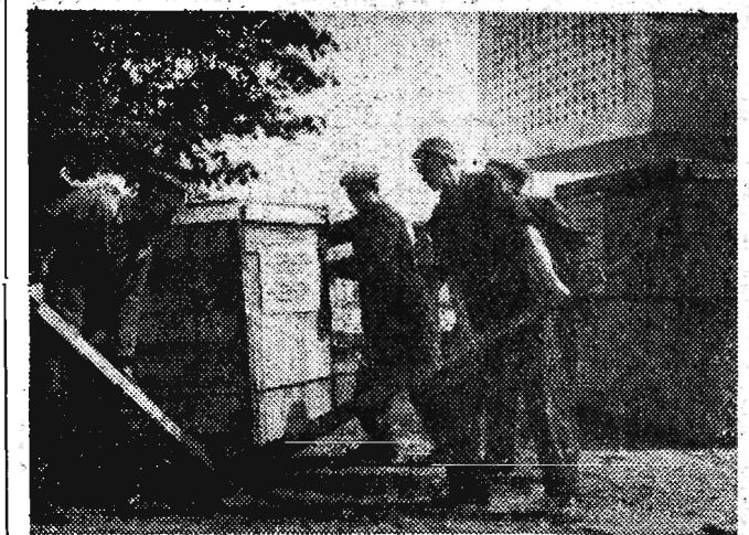
PRZED XXVI MIĘDZYNARODOWYMI TARGAMI POZNAŃSKIMI