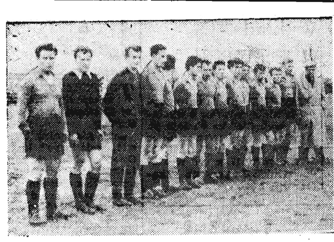
Na zdjęciu: III-ligowa drużyna Czarnych z Jasła, która w dniu 2 maja rozegrała towarzyskie spotkanie z CWKS Kraków, przegrywając 1:2.