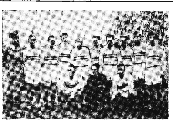
Na zdjęciu: Drużyna CWKS Kraków.