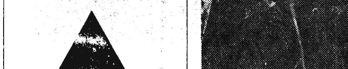
Na zdjęciu: Wyładunek skrzyń z eksponatami z ZSRR.

Na tereny Targów w Poznaniu nadchodzą stale transporty eksponatów, wystawców zagranicznych.