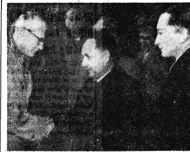
Na zdjęciu: Powitanie na Dworcu Wschodnim w Berlinie. Przewodniczący Izby Ludowej NRD dr Johannes Dieckmann (z lewej) i Marszałek Sejmu PRL Czesław Wycech wymieniają uścisk dłoni.