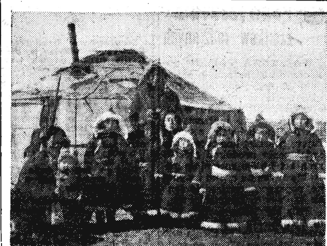
Srodkowo — mongolski Okręg Autonomiczny powstały 1 maja 1947 r. był pierwszym narodowościowym okręgiem autonomicznym w Chinach. Okręg ten leży w Północnych Chinach, graniczy z ZSRR i Mongolską Republiką Ludową i obejmuje obszar 1.400.000 km². Liczba ludności wynosi 8.700.000. Na zdjęciu: W spółdzielni produkcyjnej „Zwycięstwo”, do której należy 12 rodzin, jest 22 dzieci poniżej 10 lat — oto kilkoro z nich.

Wiem, że w tym, by naród niemiecki osiągnął zjednoczenie w warunkach demokracji i pokoju.