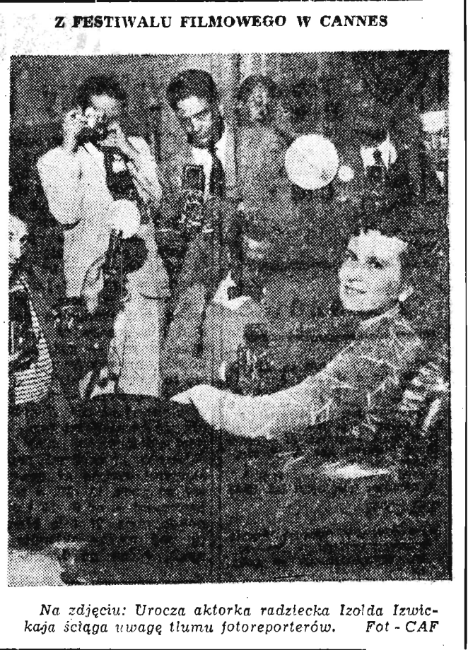
Na zdjęciu: Uroczą aktorka radziecka Izolda Izwicka ściga uwagę tłumy fotoreporterów.

To, czego dokonaliśmy wspólnie w Pradze, stanowi dopiero pierwszy krok. Próbujemy i będziemy nadal próbować nowych metod — szerszych i głębszych — wzajemnej współpracy gospodarczej. Chcemy zerwać ze sztywnością, która wkradła się w pewnej mierze do stosunków ekonomicznych między naszymi krajami w poprzednim okresie.