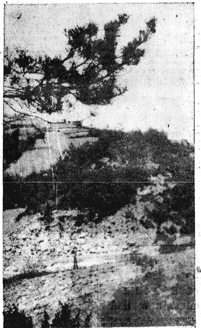
Widok z Cergowej Góry na osuwisko

Wrzask z usuwaniem się terenu na całym obszarze, wynoszącym do 300 m długości i ponad 70 m szerokości, powstały liczne szczeliny i skaliste przepaście, dochodzące miejscami do 20 m głębokości. W przepaściach tych spiętrzyły się olbrzymie masywy skalne. Kamieniołom został zamknięty na okres 6 dni. Od 13 bież. miesiąca nie zanotowano dalszych osunięć terenu. Jednakże podczas opadów atmosferycznych osuwanie takie może nastąpić. Dlatego też przebywający na terenie osuwiskowym muszą zachować wszelkie środki ostrożności.