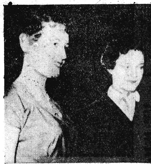
Na zdjęciu od prawej strony: Miss i wice-miss Mielca.