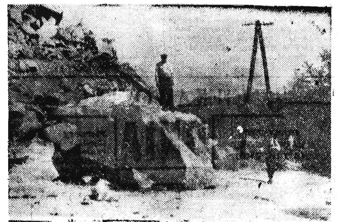
„Półtora tysiaca ton olbrzymich głazów zwałilo się na szosę.