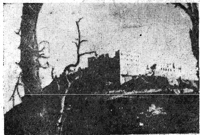
Pierwsze dwa z zamieszczonych zdjęć przesłał nam ob. Michał Czartoryski — uczestnik bitwy pod Monte Cassino.