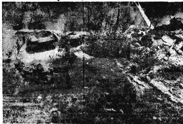
Zdjęcie to wykonane zostało z 25-metrowej skarpki.