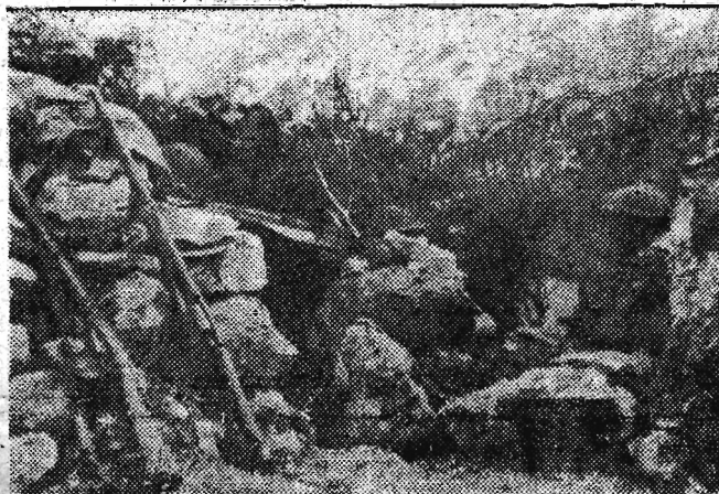
Na zdjęciu u góry: Polskie pozycje pod Monte Cassino.