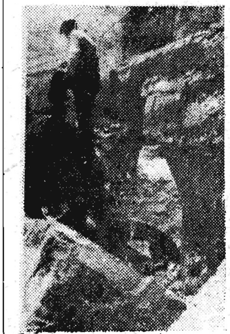
W kilku miejscach utworzyły się głębokie przepaście...

KAIR (PAP). Jak donoszą z kairskich kół poinformowanych, w dniu 18 bm. prezydent Nasser wydał dekret zatwierdzający ostatecznie dzień 3 lipca br. jako termin egipskich wyborów parlamentarnych. Będą to pierwsze wybory w Egipcie od roku 1952, tj. od czasu obalenia króla Faruka przez juntę rewolucyjną. W parlamencie egipskim zasiadać ma 350 posłów.