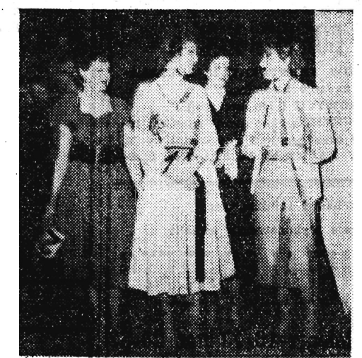
Kardydatki na miss Mielca.

się obrazki sceniczne, żarty rysunkowe, piosenki, monologi oraz program zespołu jazzowego ZDK Stalowa Wola i konkursy „Zgaduj-zgadula” cieszyły się sympatią publiczności.