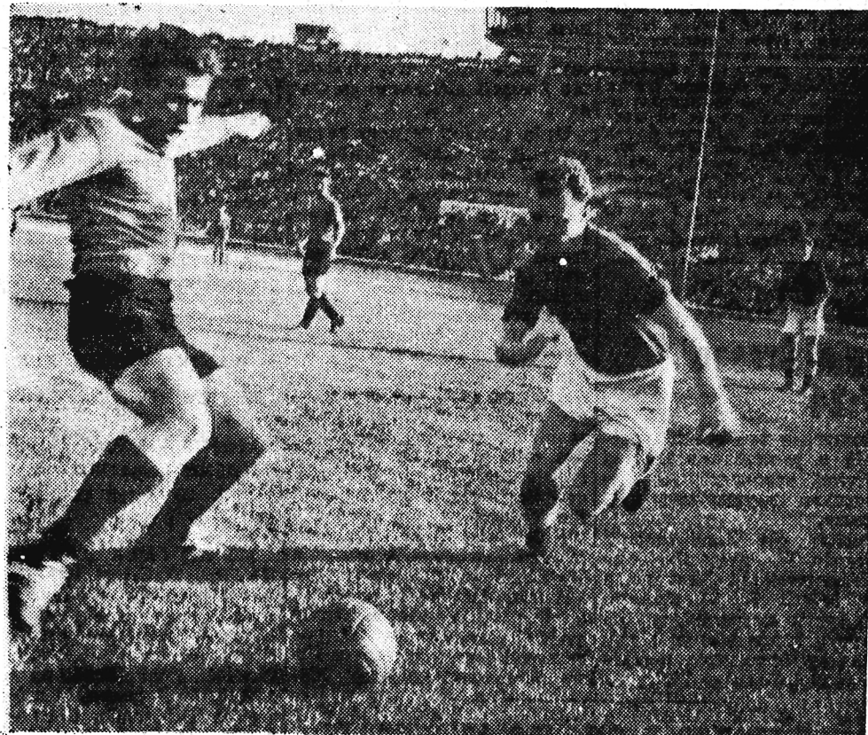
Półfinałowe spotkanie o Puchar Polski Gwardia Warszawa — ŁKS Łódź, które miało być rozegrane 7 bm. zostało przelożone na 10 bm.