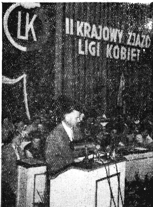
Na zdjęciu: Wicepremier Piotr Jaroszewicz pozdrawia w imieniu kierownictwa partii i rządu II Krajowy Zjazd Ligi Kobiet.

WARSZAWA (PAP). 14 bm. — w trzecim i ostatnim dniu obrad II Zjazdu Ligi Kobiet zakończono dyskusję ogólną. Zjazd wybrał nowe władze i zatwierdził nowy statut organizacji oraz uchwalił apel do kobiet polskich w sprawie zakazu doświadczeń z bronią termojądrową.