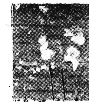
Na zdjęciu: listopadowe bratki

o godz. 6 rano w Lesku zanotowano przeszło minus 4 stopnie, a w Baligródzie minus 5. (tab)