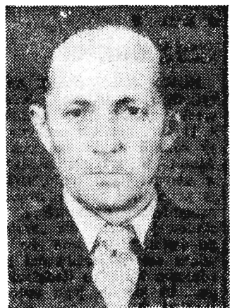
Welfriedrich, zbrodniarz wojenny, poszukiwany przez władze bezpieczeństwa NRD.