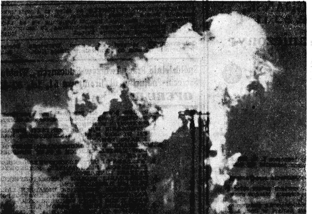
Zdjęcie to dokonane zostało na przylądku Canaverel na Florydzie w momencie eksplozji rakiety amerykańskiego sztucznego satelity podczas nieudanej próby jego wyrzucenia.