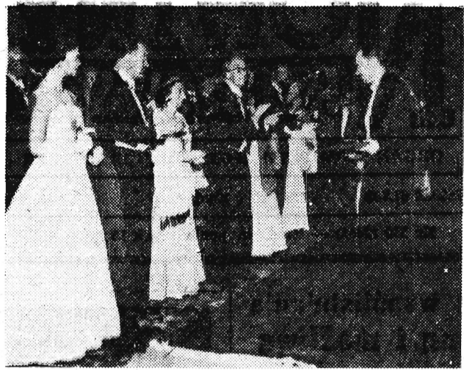
W Sztokholmie odbyła się 10 grudnia 1957 r. uroczystość wręczenia przyznanych w bieżącym roku nagród Nobla za prace z dziedziny fizyki, chemii, medycyny i literatury. Dyplomy i złote medale wręczył laureatom król Gustaw Adolf. Na zdjęciu: Laureat nagrody w dziedzinie literatury A. Camus (Francja) okłaskiwany przez rodzinę królewską w chwili po otrzymaniu nagrody.