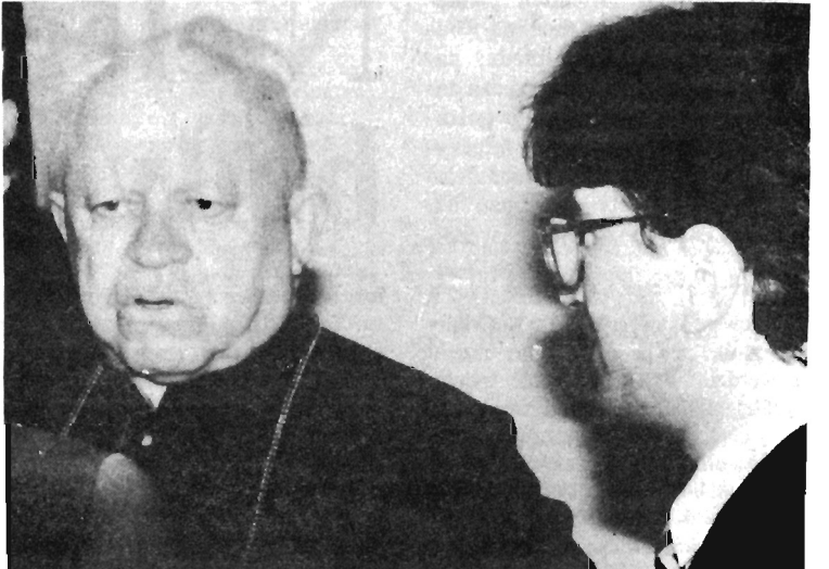
Przed rozpoczęciem uroczystej sesji, arcybiskup Ignacy Tokarczuk rozmawiał m.in. z wojewodą A. Pęziółem