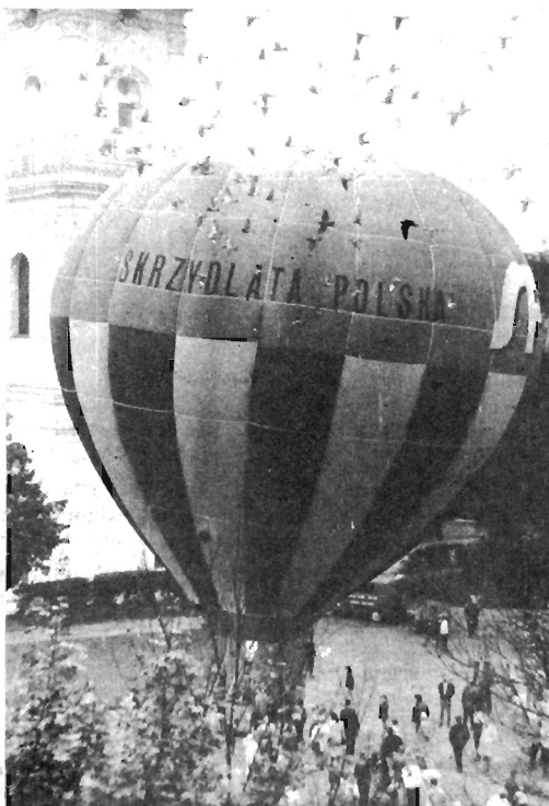
Jesienne odloty

Uwaga — zdjęcia przysyłane na konkurs powinny być czytelnie podpisane — tytuł pracy, nazwisko i imię oraz wiek autora.