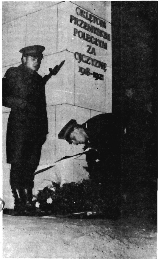
Złożenie wieńców u stóp pomnika

W Przemyślu obchody 75 rocznicy odzyskania niepodległości rozpoczęły się 10 listopada na Cmentarzu Wojskowym przy Grobie Nieznanego Żołnierza. W okolicznościowym przemówieniu wojewoda przemyski Adam Pęziół powiedział m.in.: (...) — Jestem przekonany, że Przemyśl, doświadczony na przestrzeni swoich dziejów niezwykle bogato, również w listopadzie 1918 roku, ma wszelkie szanse ku temu, aby wpisać się trwale w dzieło budowania nowoczesnego państwa polskiego. Przemyśl powinien stać się miejscem spotkania tego wszystkiego, co na przestrzeni wieków tworzyło ważne wartości cywilizacji chrześcijańskiej: tolerancji, szacunku dla drugiego człowieka i dialogu różnych narodów, kultur i religii. W sposób ważny wspierać ten proces może planowane w sier-