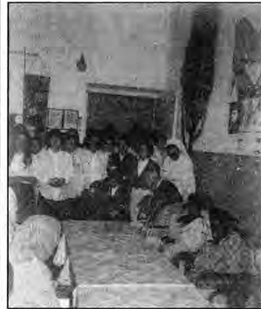
W Domu Pomocy Społecznej w Moszczanach

6 stycznia, w święto Trzech Króli, uczniowie jarosławskiego Liceum Ekonomicznego odwiedzili pensjonariuszy Państwowych Domów Pomocy Społecznej w miejscowościach Wysock i Moszczany.