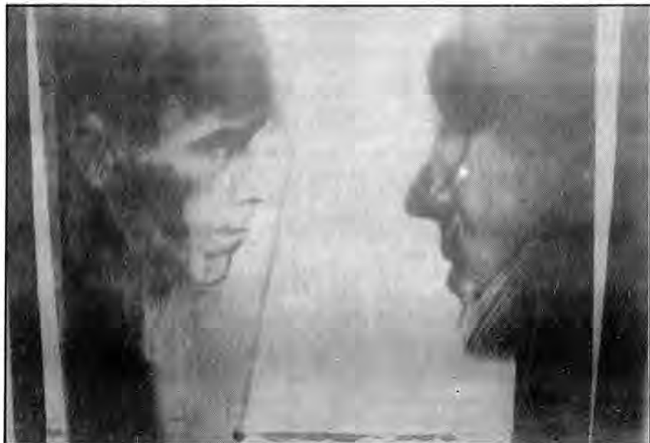
Praca Marii Ferenc

Już po raz kolejny Państwowa Galeria Sztuki Współczesnej w Przemysku była organizatorem konkursu dla artystów-plastyków z województwa przemyskiego. Na konkurs „Rysunek 93” wpłynęło 41 prac wykonanych przez 15 autorów w ubiegłym roku. Wszystkie prezentowały bardzo wysoki poziom.