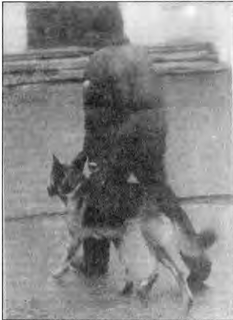
Psy powinny być wyprowadzane na smyczy

W ubiegłym roku na terenie województwa przemyskiego ogłoszono kilka obszarów zagrożonych wścieklizną. Nowy rok również nie zaoszczędził zmartwień i kłopotów związanych z tą chorobą, tym razem władzom i mieszkańcom Przeworska.