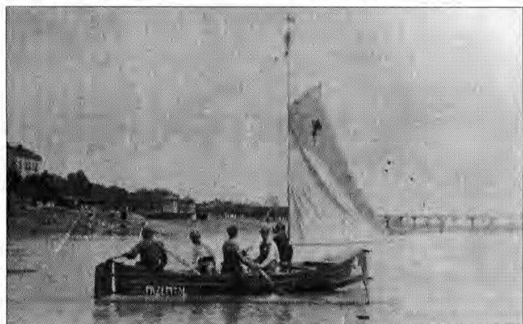
Spływ do Gdańska (1925 rok).