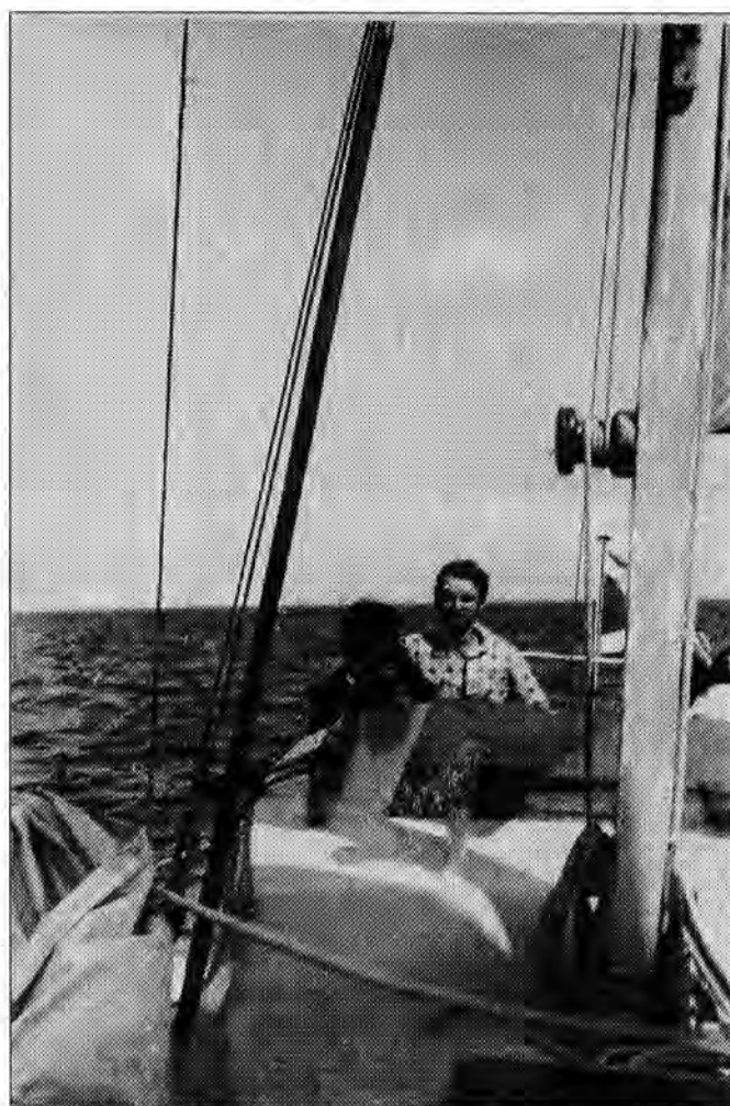
Harcerze z XIV PHDW pływają też po morzu.

Rejs zakończył się w rumuńskiej Konstancy, gdzie doszło do spotkania z polskim żaglowcem szkolnym „Lwów”. Sława o wyczynie przemyskich harcerzy dotarła nawet do rumuńskiego dworu królewskiego, nie mówiąc o licznych artykułach w centralnej i lokalnej prasie polskiej.