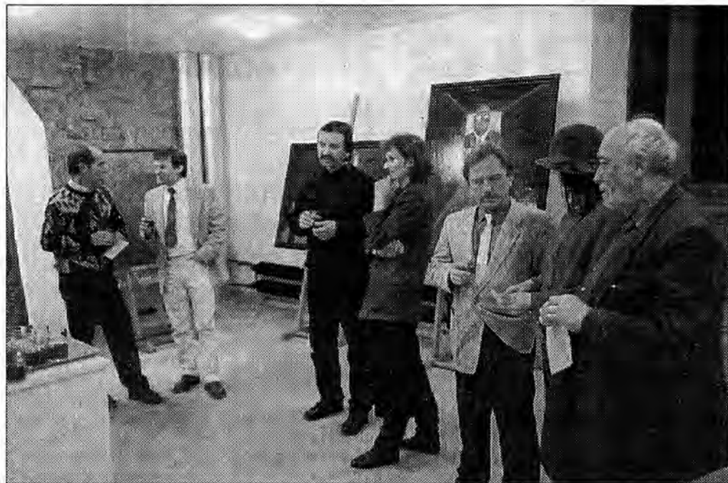
Wernisaż wystawy malarstwa plastyków z Lubaczowa.

W przeciwieństwie do lat ubiegłych w bieżącym roku starannie dobierano repertuar, sięgając po popularne w latach 60., 70. itd. przeboje. Pojawiły się więc „Kaszany” i „Dozwolone od lat osiemnastu”, „Kwiat jednej nocy” i „Jedzie pociąg z daleka”. Pojawiły się zespoły 2-osobowe składające się z solistki wykonującej piosenkę baladową przy akompaniowaniu gitary. Wykonywano także typowe piosenki nastolatków ale nie powtarzały się one aż tak często jak w latach ubiegłych. W dalszym ciągu zbyt rzadko przygotowujący solistów przeprowadzają z nimi ćwiczenia dykcji, nie dba się również o choreografię. Choć w tym względzie wyjątek stanowił zespół wokalny z Iskani. Oby jedna jaskółka uczyniła wiosnę.