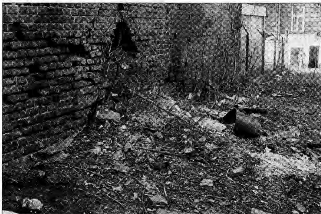
Śmietniko przy ulicy Rejtana.