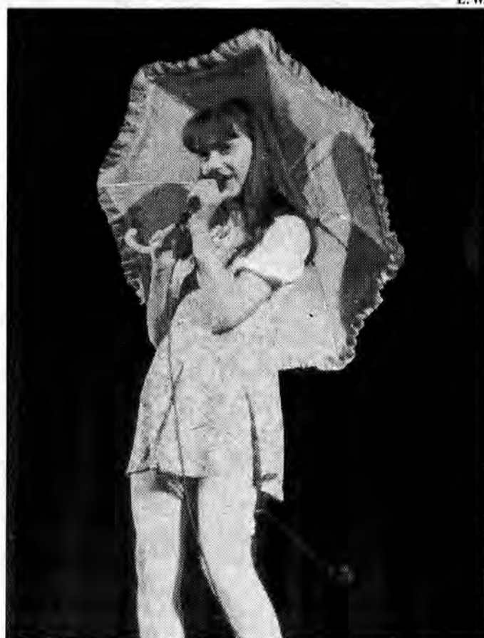
Dzieci wykazały się nie tylko dużymi umiejętnościami wokalnymi ale i interpretacyjnymi.

Zaprezentowano także program poetycki w reżyserii Jolanty Juzwy w wykonaniu uczniów SP nr 11. Dzieci recytowały wiersze Słonimskiego, Gałczyńskiego, Tuwima.