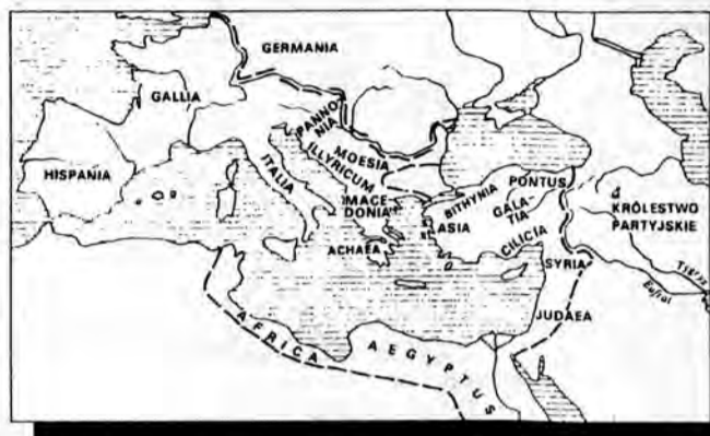
Cesarstwo Rzymskie (14 r. n.e.).

Coraz bardziej zagubiony i zastraszonego prefekta zapytał: