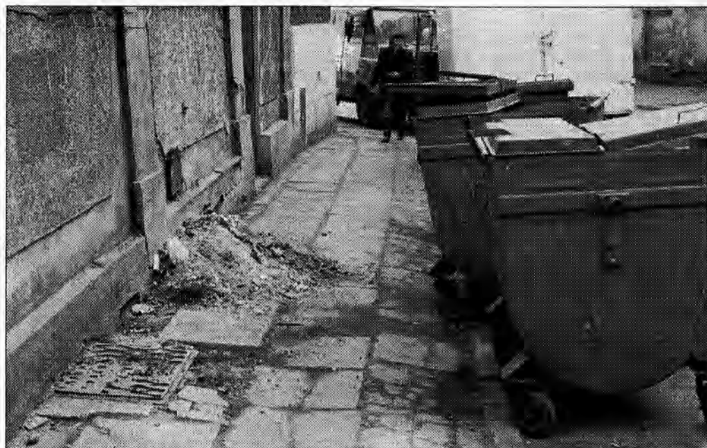
Widoczek z ulicy Bibliotecznej.