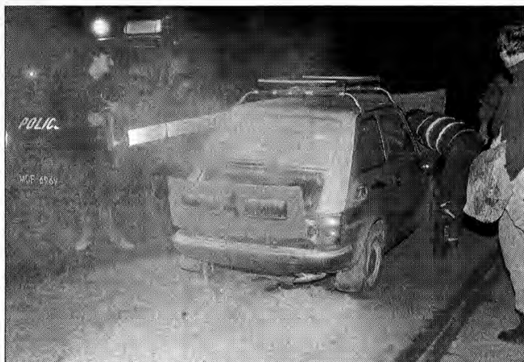
Tytułowy maluch i ratownicy.

W tym wszystkim najdziwniejsza była reakcja kierowcy, który zniknął, pozostawiając swoje cztery kółka na pastwę płomieni. Różnie komentowali to przypadkowi świadkowie – jedni twierdzili, że pobiegł do domu po gaśnicę, inni podejrzewali, że pożar powstał, kiedy kierowca chuchnął w stronę silnika i widząc płomienie wołał stracić auto niż dmuchać w alkomat. Coś w tym jednak musiało być, bo policjant, który 20 minut później trafił do mieszkania właściciela, zastał go w stanie wskazującym na spożycie.