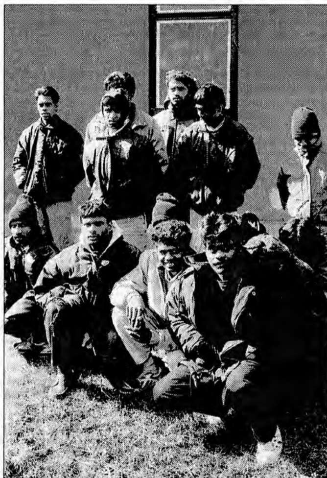
Na zdjęciach: Ujęci Lankijczycy na terenie Bieszczadzkiego Oddziału Straży Granicznej.

Funkcjonariusze Urzędu Celnego w Przemyślu w czasie służby na przejściu granicznym w Medyce widzieli już niejedną kontrabandę i wydawać by się mogło, że nie zaskoczy ich żaden, nawet najbardziej pomysłowy przemyt. Jednak nie mogli opanować zdumienia, kiedy w niedzielę (16 marca) w rumuńskim Tirze, załadowanym sklejką, odkryli 33 ludzi „wprasowanych” pomiędzy palety. Czegoś takiego jeszcze w Medyce nie było. Rekordowy przemyt żywego towaru – tak komentowali „odkrycie” funkcjonariusze UC.