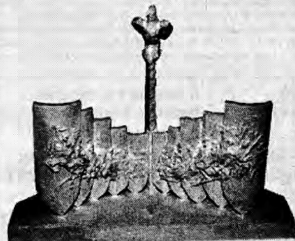
Zwycięski projekt pomnika Żołnierza Polskiego. Pozostałe wyróżnione projekty można oglądać do 11 kwietnia 1997 r. na wystawie pokonkursowej w Muzeum Narodowym Ziemi Przemyskiej.