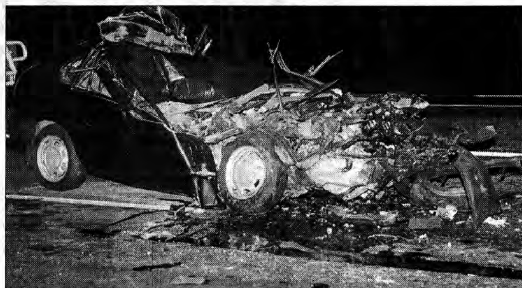
Zanim przyspieszysz – pomyśl!

Ważną cechą auta jest współczynnik oporu powietrza coraz częściej podawany przy danych