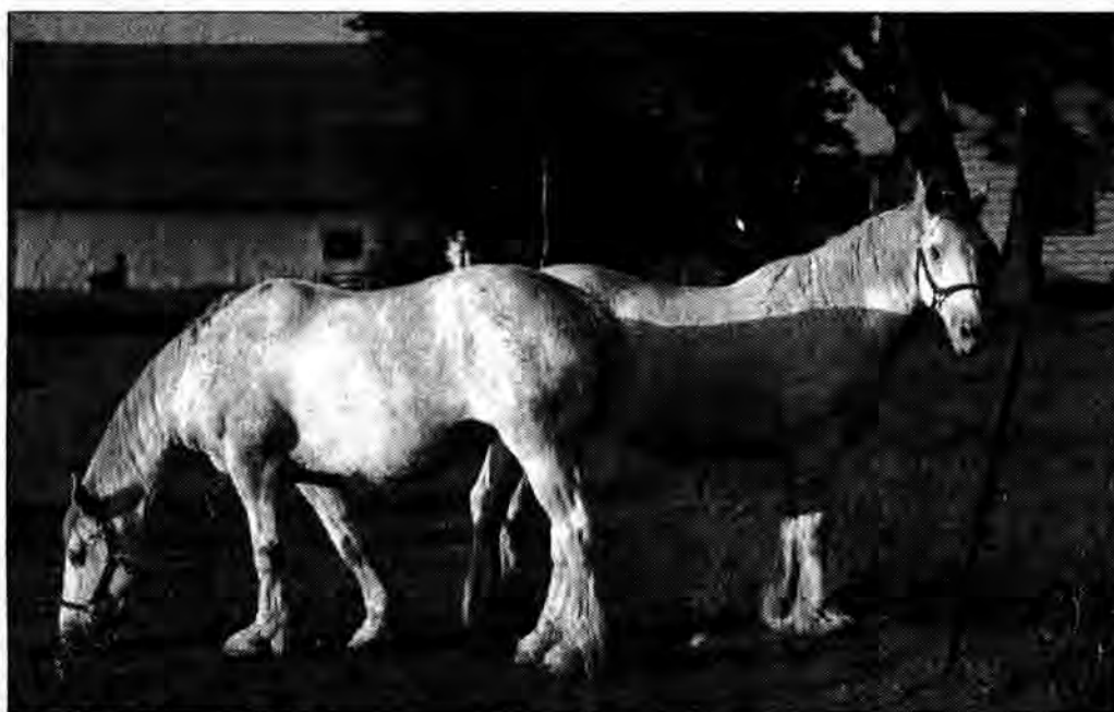
(A) Czego ci ludzie nie wymyślą.

Gdyby ktoś z naszych czytelników (hodowców koni i posiadaczy klaczy, rzecz jasna) miał ochotę na te trzy dodatkowe, bezpłatne skoki, to informujemy jeszcze, że Drinck jest maści gniadej, Ryzator również, Eden za to karę, a Jazgot i Mason ciemno-gniadej.