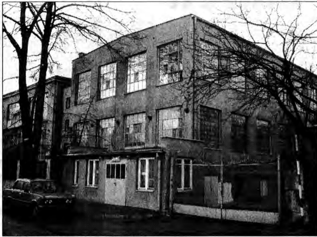
Tu ma powstać w Przeworsku centrum handlowe.

Tymczasem na początku 1997 r. w regionalnej prasie kilkakrotnie ukazały się informacje o mającym powstać w Przeworsku centrum handlowym. W ogłoszeniach zapraszano wszystkich chętnych, zainteresowanych pomysłem na spotkanie organizacyjne. Zjawili się wielu potencjalnych kupców, zarówno z grodu nad Mleczką jak i z sąsiednich miejscowości. Okazało się, że intencją pomysłodawców spotkania była próba organizacji