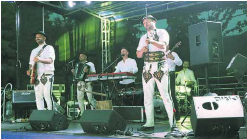
„Jak się bawią ludzie”, „Szalejesz”, „Żyje się raz” – nie mogło zabraknąć m.in. tych utworów „Bacıarów”