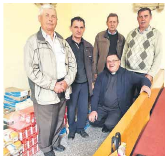
Żywność została dostarczona do Chyrowa

Żywność ta została dostarczona własnymi samochodami do Chyrowa – miejscowości zaprzyjaźnionej z Kosiną, na ręce tamtejszego proboszcza ks. Włodzimierza Stogusza. Zgromadzenie tak dużej ilości żywności było możliwe dzięki ofiarności mieszkańców Kosiny i zaprzyjaźnionych rodzin z sąsiednich miejscowości. Koło Emerytów i Rencistów wszystkim, którzy okazali otwarte serce na nieszczęście bliźniego i wzięli udział w tych zbiórkach serdecznie dziękuję. (iw)