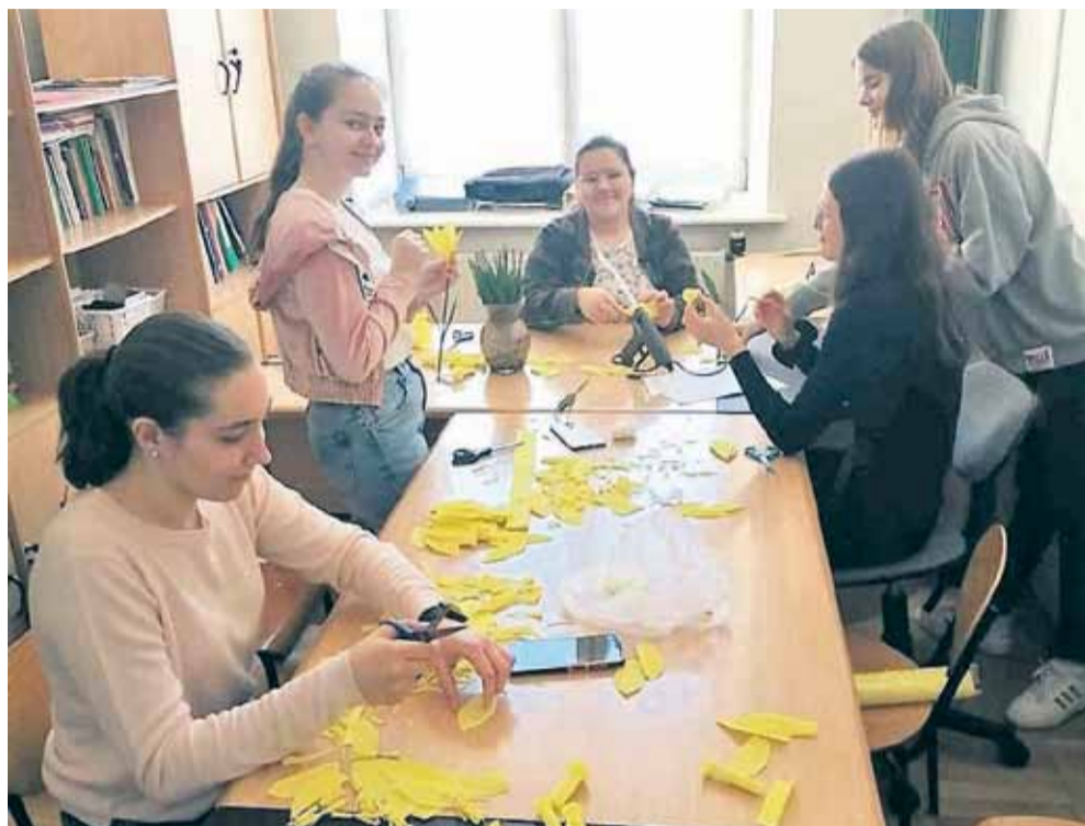
Szkolne Koło Wolontariatu podczas prac w ogólnopolskiej akcji „Pole Nadziei”