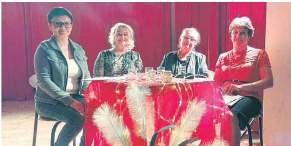
Spotkanie odbyło się 31 lipca