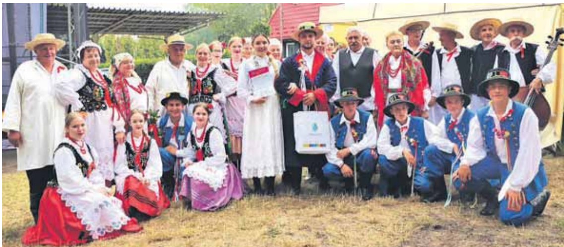
„Tkacze” z Wysokiej wrócili z Jastrzębia z II miejscem i narodą pieniężną 800 zł