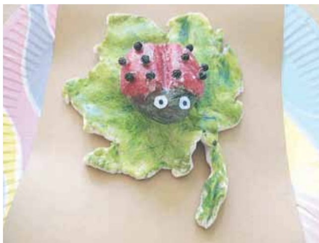
Stworzone dzieła dzieci pomalowały farbami plakaty i zabraly do domu, by pokazać domownikom