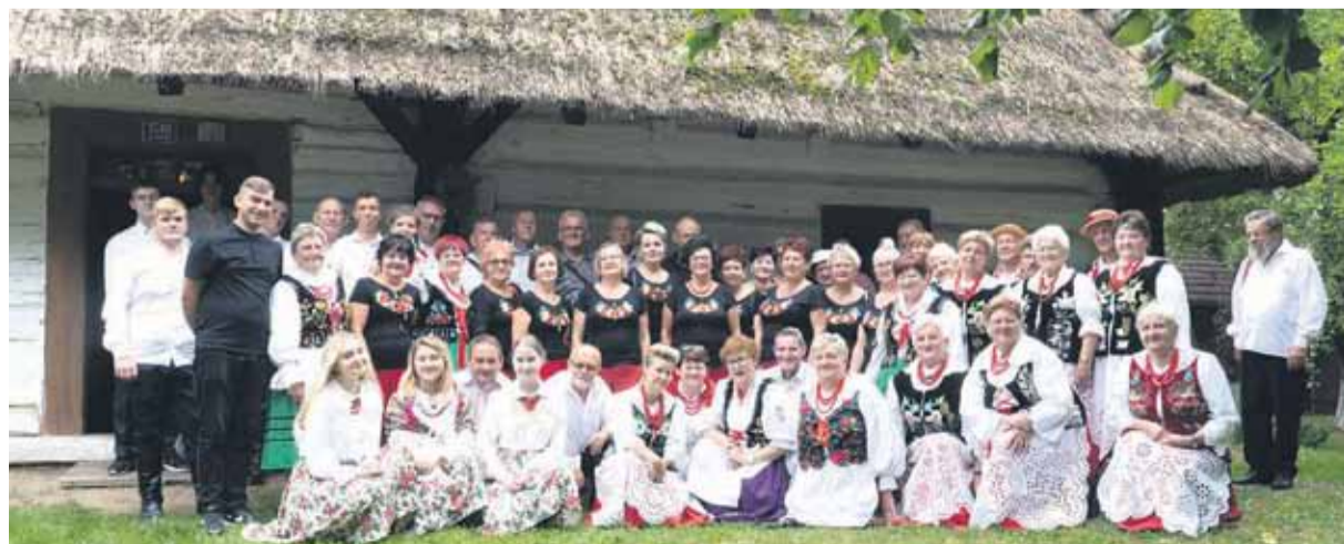
Warsztaty odbywały się w Ośrodku Kultury w Soninie a także w Skansenie w Markowej