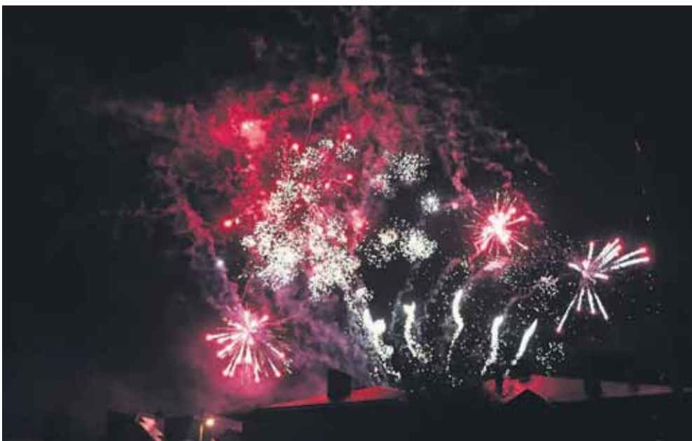
Na koniec koncertów mieszkańcy mogli podziwiać sztuczne ognie