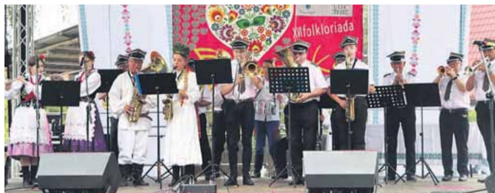
Podczas Folkloriady wystąpiła także Orkiestra Dęta z Wysokiej. Dzień później (31 lipca) zagrała na Jasnej Górze

Zespół „TKACZE” wystawił fragment z wesela wysockiego pt. „Powrót z Kościoła”. Folkloriada to nie tylko możliwość wysłuchania utworów folklorystycznych z całej Polski, czy obejrzenia prezentowanych tradycyjnych, niejednokrotnie już zapomnianych obrzędów, ale