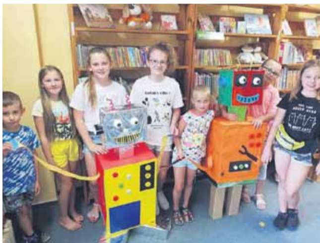
Zajęcia plastyczne w bibliotece w Albigowej