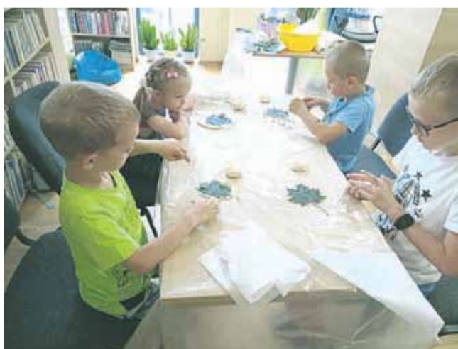
Sierpniowe zajęcia w bibliotece w Soninie były bardzo kreatywne. Dziewczynki i chłopcy wykonywali z masy solnej liście drzew i biedronki. W czasie schnięcia prac młodzi artyści świetnie się bawili grając w Dobble