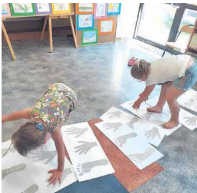
Gry i zabawy w bibliotece w Kraczkowej