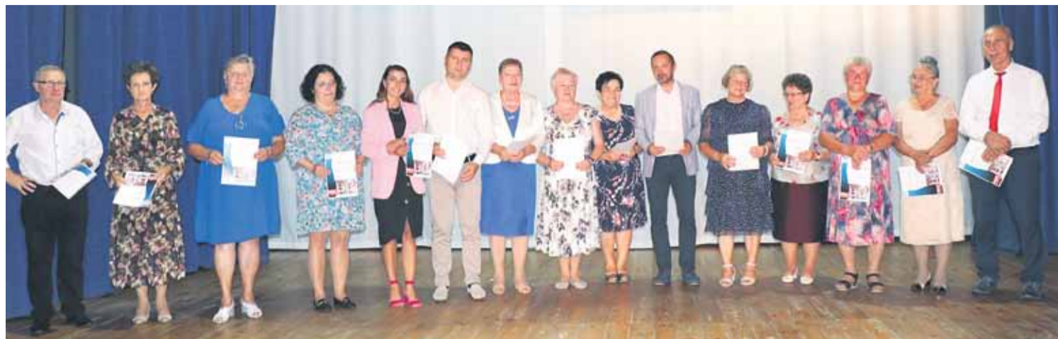
Tegoroczna Seniorada odbyła się już po raz czwarty.

Seniorzy spotkali się przy stole i uczestniczyli we wspólnej zabawie tym razem w rytm melodii w wykonaniu Kapeli Podwórkowej Wysoczanie. W części artystycznej wystąpił Zespół Śpiewaczy Klubu Seniora gospodarzy i Zespół Rogóżnianki z Ośrodka Kultury w Rogóżnie oraz Kapela Podwórkowa Wysoczanie. Serdecznie dziękujemy wykonawcom za to, że uświetnili swoim talentem nasze spotkanie. Seniorada była też okazją do złożenia podziękowań dla klubów seniora za dotychczasową współpracę i wkład w działania integracyjne na rzecz Seniorów Gminy Łańcut. Wyróżniony został szczególnie i otrzymał tytuł „Klub przyjazny integracji Seniorów” - Klub Seniora w Albigowej. Podziękowania również otrzymał Wójt, członkowie Zarządu Stowarzyszenia „Aktywny Senior” i Komisji Rewizyjnej oraz organizatorzy IV Seniorady i nasi artyści oraz dyrektor GOPS i kierownicy Domów Dziennego Pobytu Seniora w Wysokiej i Kosinie. Spotkanie przebiegło w miłej i sympatycznej atmosferze. W najbliższym czasie nasi Seniorzy wyjadą na 2 wycieczki. Kolejne