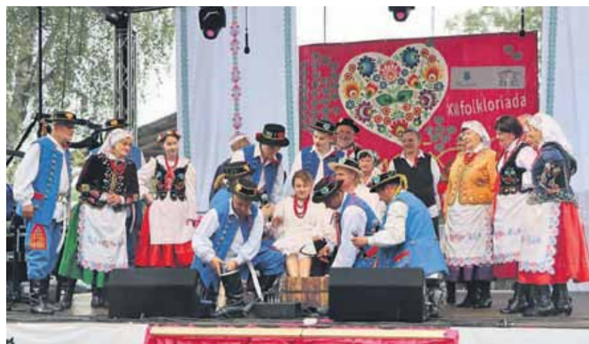
I miejsce i 1000 zł otrzymał Zespół Ludowy „Sonina”