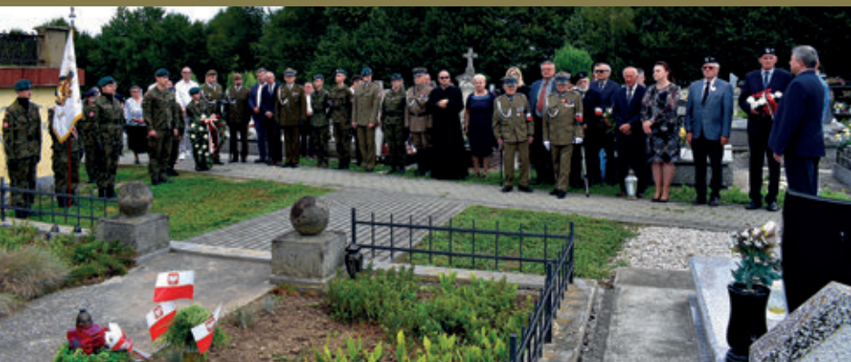
Fotorelacja z obchodów 78. rocznicy Akcji Burza w Tyczynie

należy zachować odwagę i godność. Następnie uroczystość uświetnił występ solistek i solisty z 21. Brygady Strzelców Podhalańskich. Pieśni patriotyczne jak i znane piosenki spotkały się z dużym uznaniem ze strony słuchaczy. Spotkanie zakończył żołnierski obiad. Przed wejściem do domu kultury zaprezentowane zostały tablice opisujące skrótowo dzieje Armii Krajowej oraz bitwy o Tyczyn.