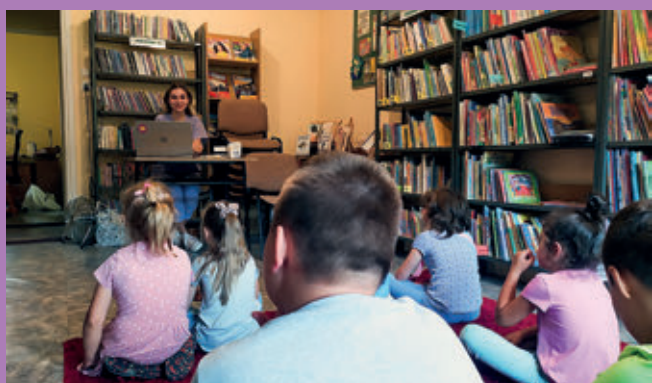
Kulturalne wakacje z domem ludowym i biblioteką w Hermanowej