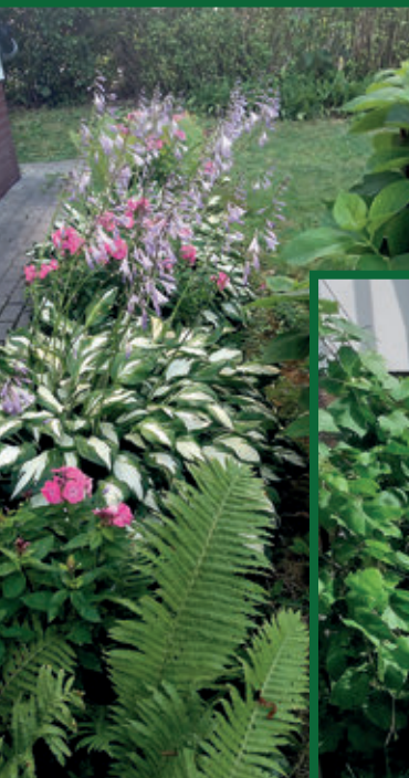
III miejsce – tereny zielone Wspólnoty Mieszkaniowej Strug w Tyczynie