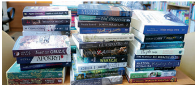
Pierwsze zakupione książki

Miejska i Gminna Biblioteka Publiczna w Tyczynie znalazła się także w gronie beneficjentów programu Instytutu Książki Kraszewski. Komputery dla bibliotek 2022 . Celem programu jest zapewnienie zrównoważonego dostępu do nowoczesnych technologii i wyrównanie szans mieszkańców miejscowości w gminach o najniższych dochodach podatkowych na jednego mieszkańca poprzez wyposażenie bibliotek w nowoczesny sprzęt komputerowy. Całkowita kwota wydatków na realizację zadania wynosi 25 500 zł , z czego 3 900 zł to dotacja celowa gminy Tyczyn przekazana bibliotece jako wkład własny na realizację zadania, a 21 600 zł to dofinansowanie ze środków Instytutu Książki. Dzięki dotacji gminy Tyczyn oraz środkom Instytutu Książki Miejska i Gminna Biblioteka Publiczna w Tyczynie zakupi dwa laptopy oraz cztery zestawy komputerowe .