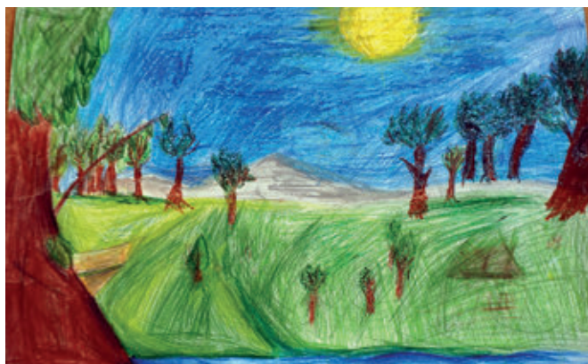
III miejsce - Oliwia Łysiak