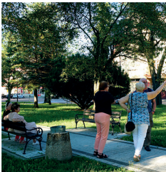
Spacer ulicami Tyczyzna