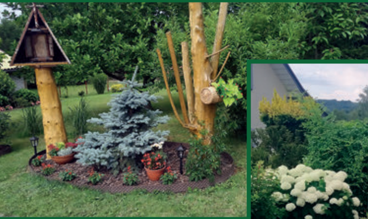
I miejsce – ogród Danuty Klimasz