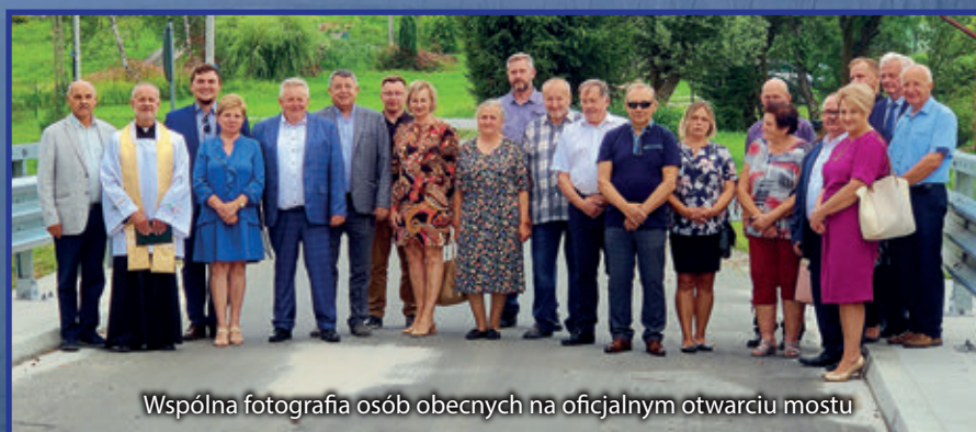
Wspólna fotografia osób obecnych na oficjalnym otwarciu mostu