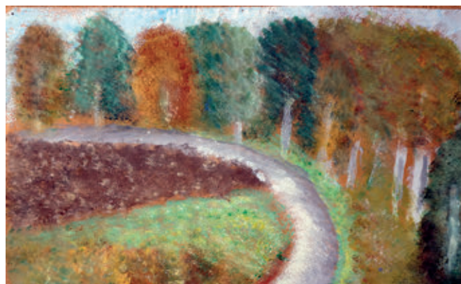
III miejsce - Ksawery Osiadły