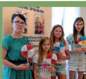
Zajęcia wakacyjne w bibliotece