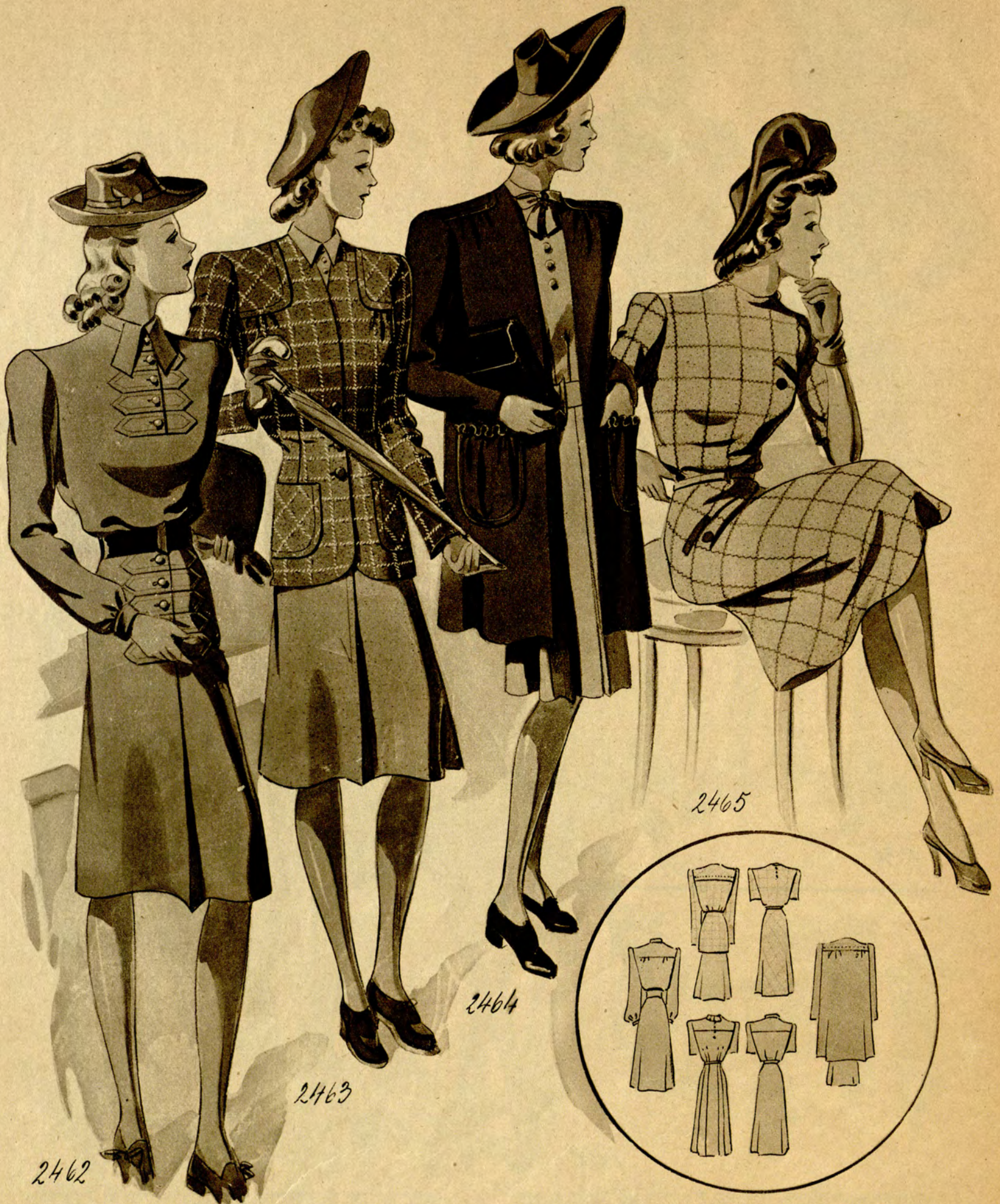
2462 Praktisches Kleid aus Modestoff, dunkler Ledergürtel. Sehr apart die geknöpften, aufgesteppten Patten. (Stoffverbrauch: 3,25 m bei 90 cm Br.) 2463 (Oberweite 88) Jugendliches Sportkostüm aus Wollstoff: einfarbiger Rock, die gemusterte Jacke ist kragenlos gearbeitet. (Stoffverbrauch: Rock 1,60 m, Jacke 2,25 m bei 90 cm Breite.) 2464 Sportkomplet aus Wollkrepp. Helles Kleid mit gebundener Hals-