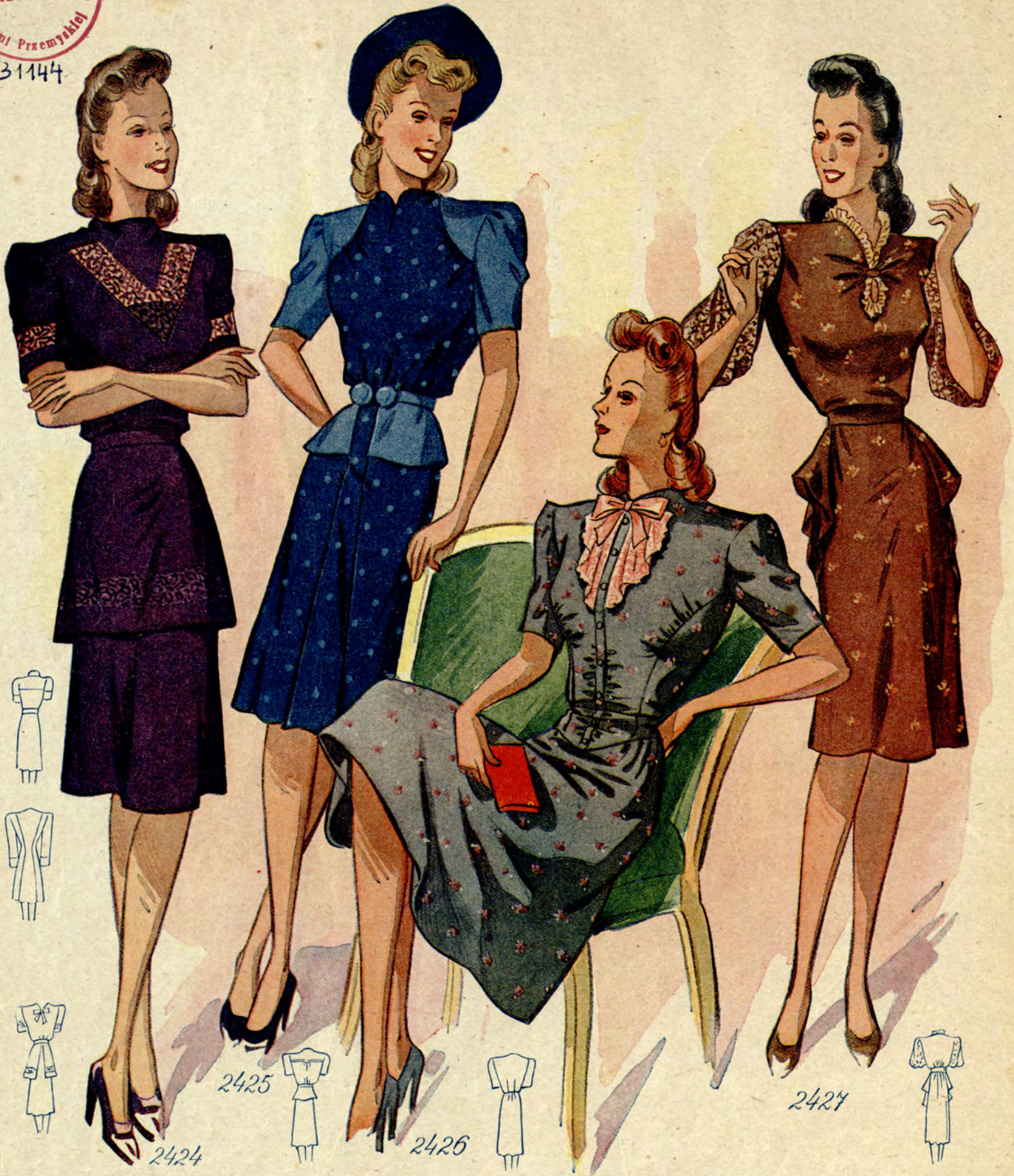
2421 (Oberweite 88 cm.) Jungdliches Kleid aus gestreiftem Jersey. Die Verwendung des Musters ist beachtenswert, Ledergürtel. (Stoffverbrauch: 2.60 m bei 130 cm Breite.) 2422 Sportmantel aus leichtem Wollstoff. Kragenlose, doppelreihig geknöpft Machart mit eingeschnittenen Taschen. (Stoffverbrauch: 3 m bei 140 cm Breite.) 2424 (Oberweite 88 cm.) Jungdliches Besuchskleid aus modelfarbiger Seide. Die Kasacke ist rückwärtig mit einer Schleife geschlossen und wird reich mit Durchbruchstickerei geschmückt. (Stoffverbrauch: 4 m bei 98 cm Breite.)