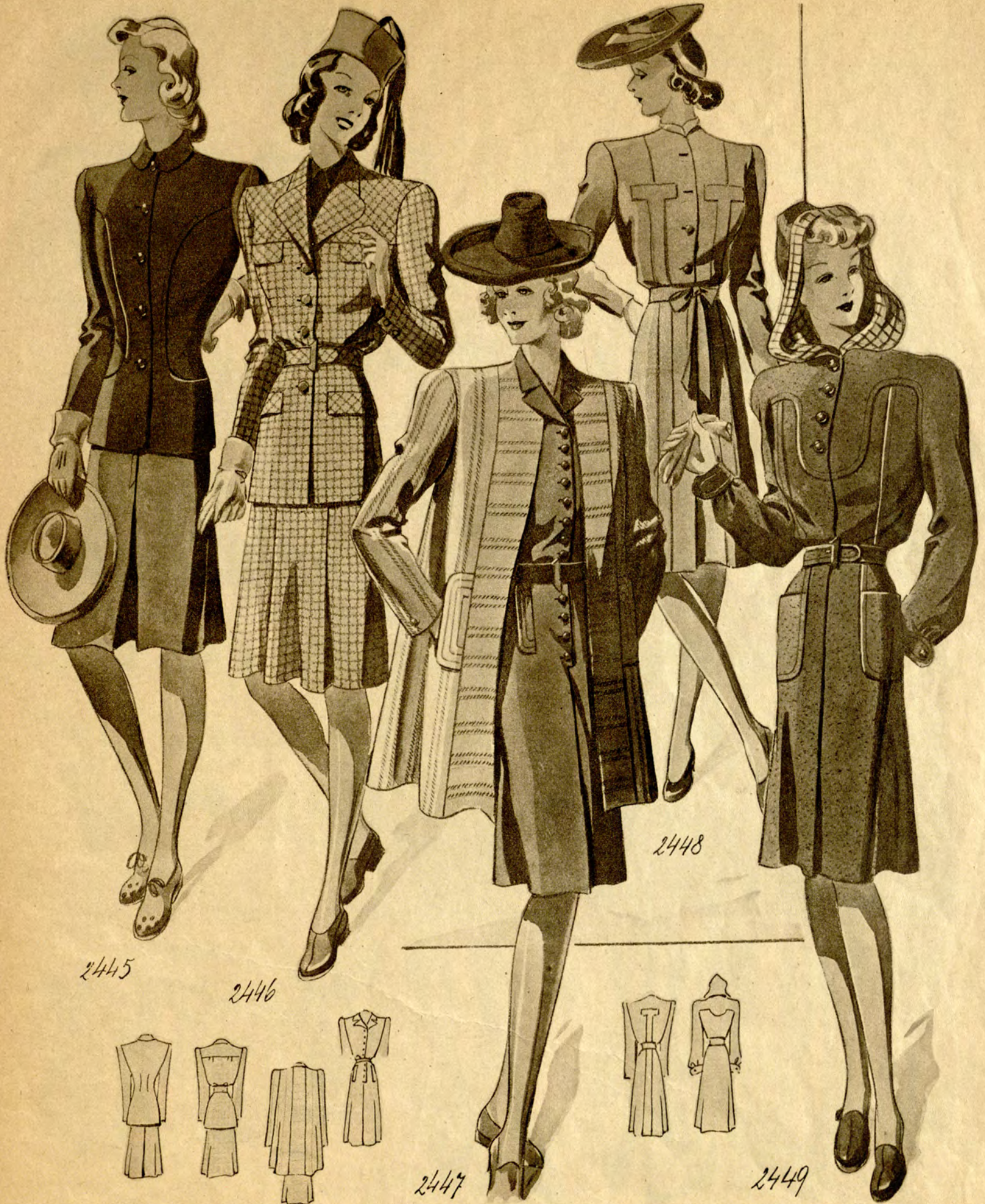
2445 Sportkostüm aus Wollstoff: zum grauen Hosenrock die rote Jacke in anliegender, einreihig geknöpfter Machart. (Stoffverbrauch: Jacke 1,50 m bei 130 cm Breite, Rock 1,80 m bei 120 cm Breite.) 2446 Kostüm aus kariertem Wollstoff; einfacher Rock. Die Gürteljacke hat vier Taschenblenden und eine Passe. (Stoffverbrauch: 3 m bei 130 cm Br.) 2447 Komplet aus Modekrepp. Einfarbiges Kleid mit dunklem Gürtel. Die gesteppten Taschenpatten wiederholen sich an der buntgestreiften,