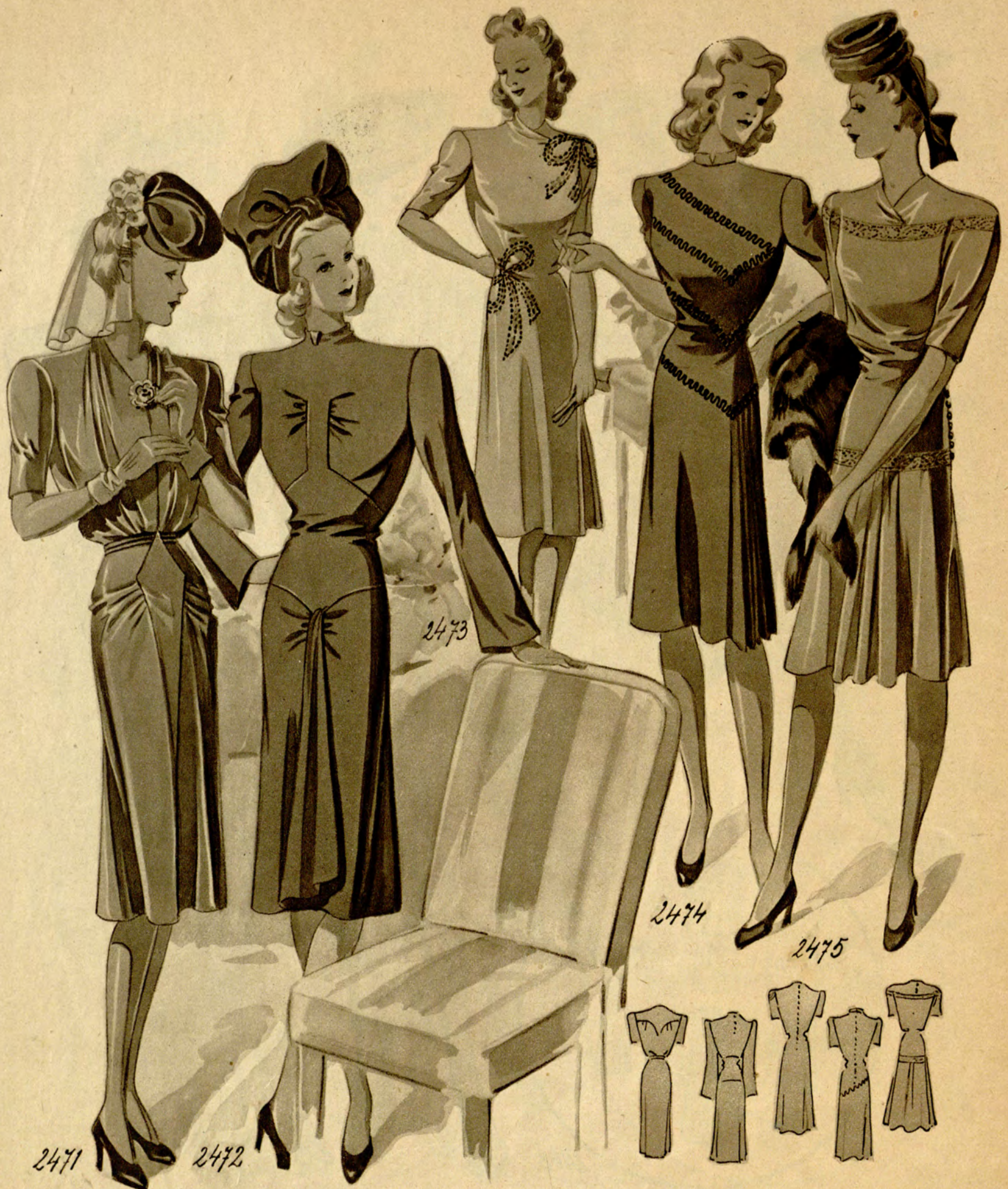
2471 Festkleid aus Satin, anmutig gezogen; kurze Ärmel. (Stoffverbrauch: 3,50 m bei 90 cm Breite.) 2472 Dieses elegante Kleid aus Modekrepp wird im Rücken mit Knöpfen geschlossen. Neu der Wasserfallteil des Rockes. (Stoffverbrauch: 4,25 m bei 90 cm Breite.) 2473 Jungliches Theaterkleid aus Seide. Große Schleifen in Perlenstickerei bilden den Aufputz. (Stoffverbrauch: 3,40 m bei 98 cm Breite.)