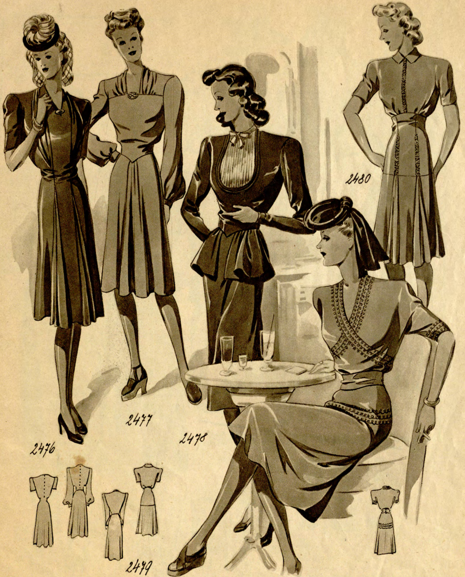
2476 (Oberweite 88) Jugendliches Festkleid aus Modeseide. Eintellige Machart, vorne zwei gezogene, eingesetzte Längsbahnen. (Stoffverbrauch: 3,50 m bei 98 cm Breite.) 2477 Modekrepp ergibt dieses Nachmittagskleid mit rückwärtig geknöpftem Oberteil und weiten Ärmeln. (Stoffverbrauch: 3,75 m bei 90 cm Breite.) 2478 Gesellschaftskleid aus Modeseide; glockiges Hüftschößchen. Plissierter