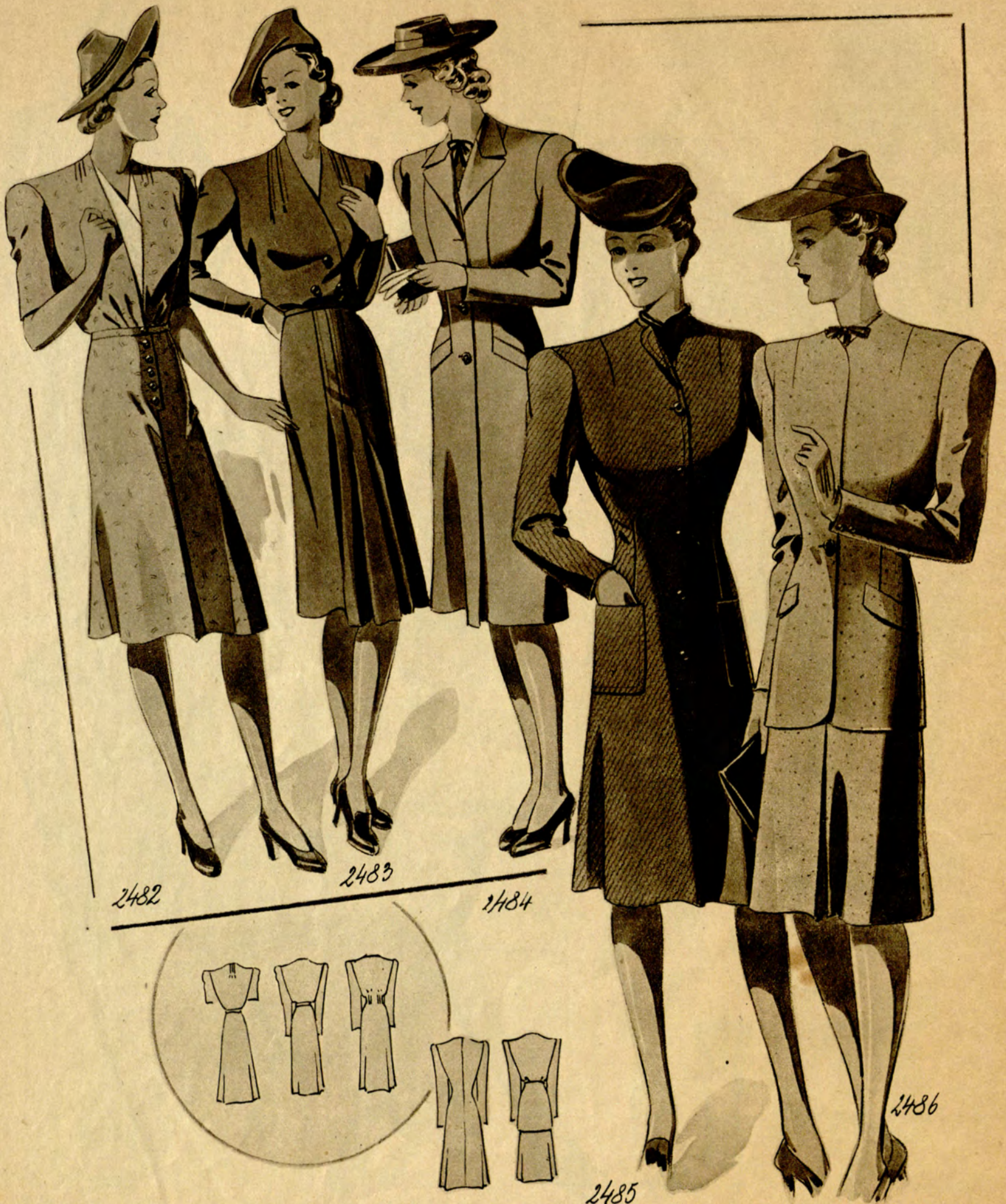
2482 Praktisches Kleid aus Noppenstoff, für Vollschanke bestimmt. Einsatz aus Leinen oder Pikee. (Stoffverbrauch: 4,25 m bei 90 cm Breite.) 2483 In diesem Kleid aus Wollstoff wird auch die starke Frau gut aussehen. (Stoffverbrauch: 4,50 m bei 90 cm Breite.) 2484 Dieser Mantel aus Tuch ist für stärkere Damen gedacht. Einfache Machart mit Taschenklappen. (Stoffverbrauch: 3 m bei 130 cm Breite.)