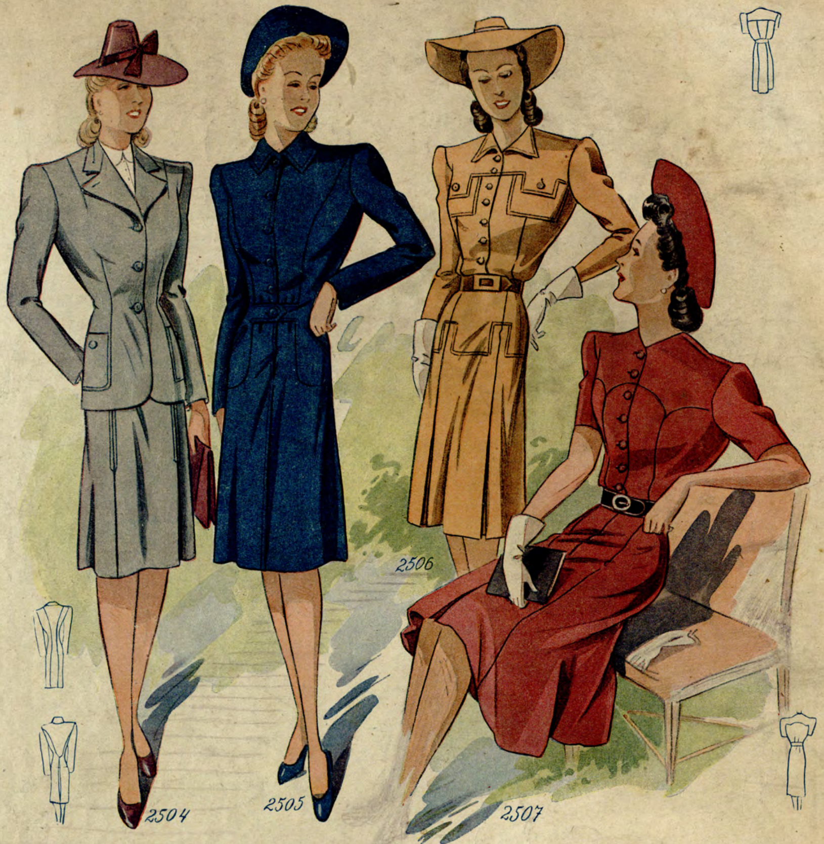
2504 (Oberweite 88 cm.) Jungliches Kostüm aus Wollstoff; Jacke in klassischer Machart; einfacher Rock. (Stoffverbrauch: 3 m bei 130 cm Breite.)