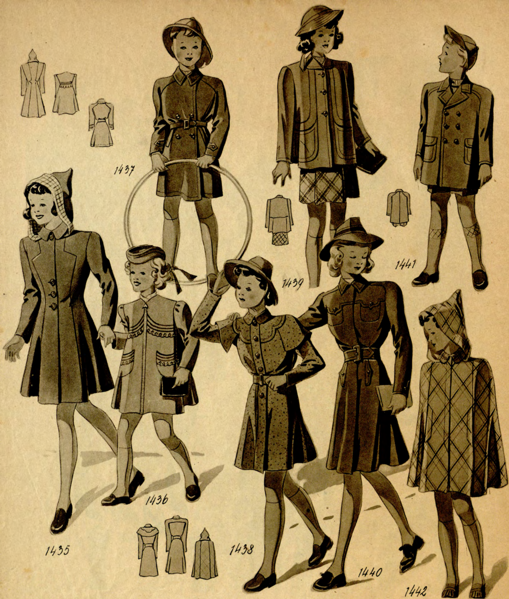
1435 Mädchenmantel aus Modestoff, Kapuze mit kariertem Futter. 1436 Hängermantel aus Wollstoff, mit Posamentierstickerei und durchgehendem Gleitverschluß. 1437 (6-8 Jahre) Regenmantel aus Gabardin, für Knaben. Raglanärmel, Gürtel aus gleichem Material. 1438 Sportmantel aus genopptem Wollstoff. Beachtenswert die Capeteile und die Form der Passe.