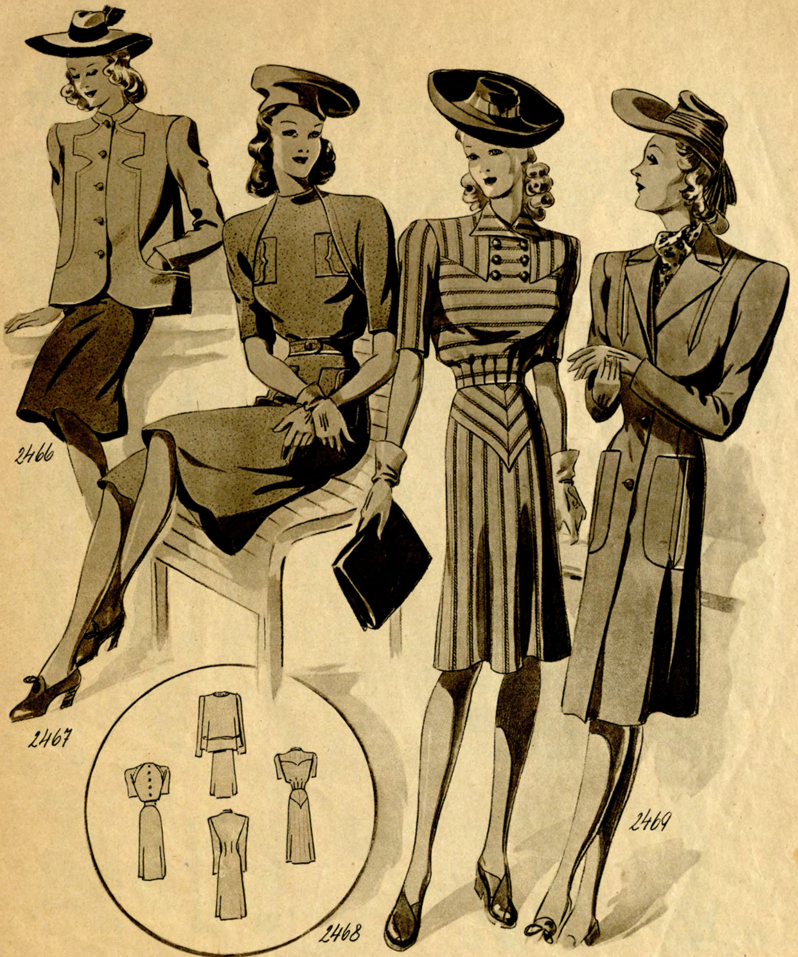
2466 Sportkostüm aus Wollstoff. Enger, dunkler Rock; die leichte Hängerjacke zeigt gesteppte Schnittlinien. (Stoffverbrauch: Rock 1,80 m, Jacke 2,10 m bei 90 cm Breite.)