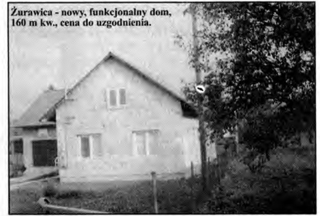
Żurawica - nowy, funkcjonalny dom, 160 m kw., cena do uzgodnienia.

POSZUKUJEMY: do sprzedaży: działki, domy, lokale / do wynajęcia: mieszkania, lokale