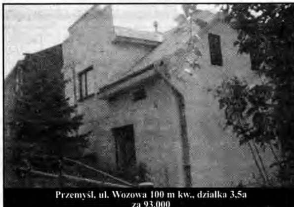
Przemysł, ul. Wozowa 100 m kw., działka 3,5a za 93.000