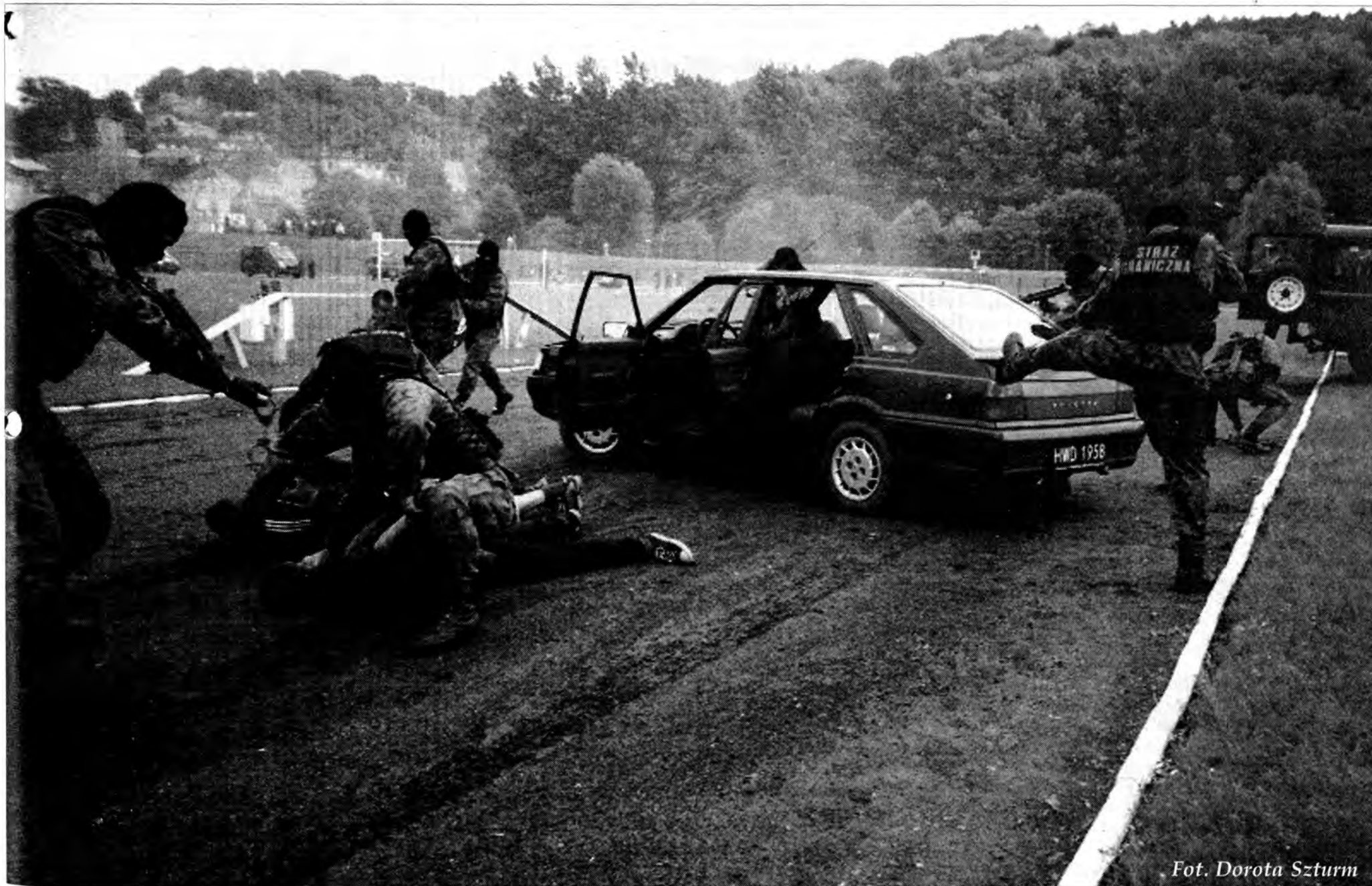
Fot. Dorota Szturm