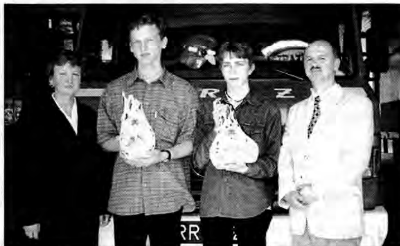
Zwycięzcy TWP na szczeblu powiatu.

"Młodzież zapobiega pożarom" - pod takim hasłem odbył się turniej wiedzy pożarniczej, na szczeblu powiatowym. Miejscem, gdzie rywalizowała młodzież był teren Komendy Miejskiej Państwowej Straży Pożarnej w Przemyślu.