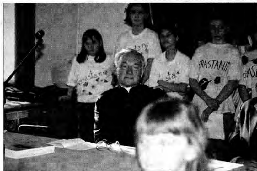
Uroczystą promocję książki, która odbyła się w Archiwum Państwowym w Przemyślu, uświetniły występy artystyczne dzieci z Przemyśla, Radymna i Łopuszki.

wyznaczane jest przez święta kościelne, pory roku i rytm prac polowych. Podkreśla to układ tej części pracy, która opisuje – niczym w reymontowskich "Chłopach" – zwyczaj roku, tu od zimy po tragiczną jesień '39. Czytelnik