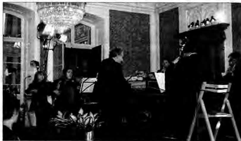
Barokowa orkiestra "Musicae Antiquae Collegium Varsoviense".

Przez cały tydzień, od 12 do 19 maja, łańcucki zamek rozbrzmiewał muzyką w ramach Festiwalu Muzycznego - już po raz czterdziesty!