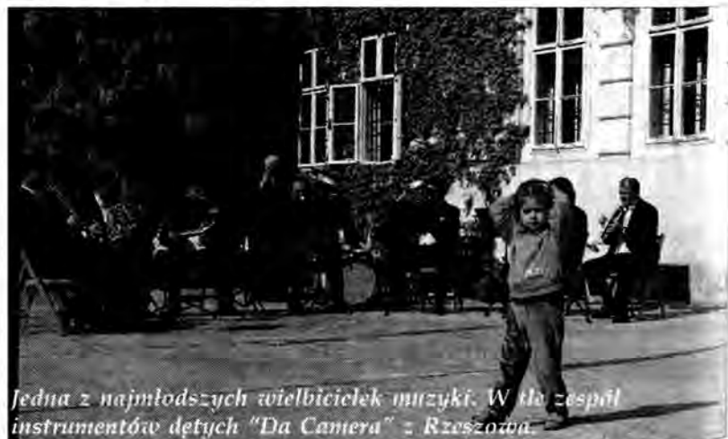
Jedna z najmłodszych wielbicielki muzyki. W tle zespół instrumentów dętych "Da Camera" z Rzeszowa.

Tygodnik "POGRANICZE" © Wydawca: "Publikator" Sp. z o.o., pełnomocnik: Wiesław Pawłowski - 676-02-80. 37-700 Przemysł, ul. Mnisza 3, tel/fax 675-10-10, centrala 675-10-12, e-mail: redakcja@pogranicze.com.pl Redaguje zespół: redaktor naczelny: Zdzisław Szelięga, dziennikarze - Zdzisław Besz, Piotr Czech (Jarosław), Hubert Lewkowicz, Dorota Szturm. Skład komputerowy - Studio Pogranicze: Katarzyna Walczyszewska. Korekta - Barbara Musiał. Druk: Rzeszowskie Zakłady Graficzne SA. Poglądy redakcji nie zawsze są zgodne z poglądami autorów, lecz publikacje zamieszcza się przestrzegając konstytucyjnej zasady wolności słowa. Za treść ogłoszeń redakcja nie odpowiada. Materiałów nie zamówionych nie zwraca. Zastrzega sobie również prawo skracania i opracowywania tekstów. O warunkach prenumeraty informują wszystkie placówki "Ruch" oraz urzędy pocztowe.