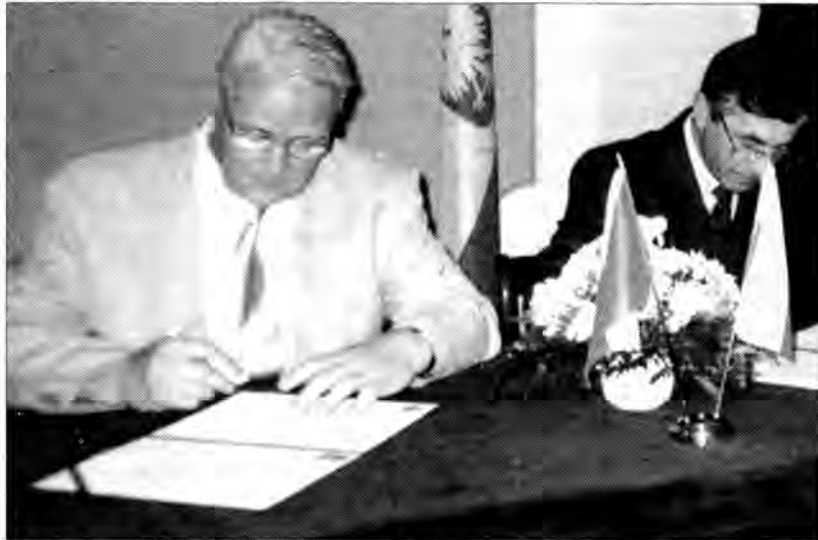
Burmistrzowie Vyskova i Jarosławia podpisują umowę o współpracy.

Czeski Vyskov został trzecim miastem partnerskim Jarosławia. Umowę o współpracy władze obu miast podpisały 12 maja, w jarosławskim Ratuszu. Było to możliwe dzięki wspólnemu partnerowi obu miast - słowackim Michalovcom. Trzy wymienione grody chcą teraz stworzyć partnerski trójkąt.