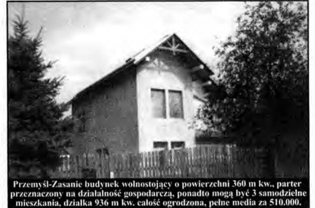
Przemysł - Zasanie budynek wolnostojący o powierzchni 360 m kw., parter przeznaczony na działalność gospodarczą, ponadto mogą być 3 samodzielne mieszkania, działka 936 m kw. całość ogrodzona, pełne media za 510.000.

Przemysł, ul. Puskina, 100 m kw., w domu jednorodzinnym, po remoncie za 135.000*, Przemysł, os. Rycerskie, 86 m kw., 4 pokoje + garaż za 112.000*, Przemysł, ul. B. Spiechowicza, 44 m kw., dwa pokoje za 75.000*, ul. Lwowska 74 m kw. za 81.000*, zamiana - nowe budownictwo 4 pokoje, 58 m kw. na Kmieciach - na stare budownictwo*, ul. Franciszkańska, 1 p. 85 m kw., za 65.000*