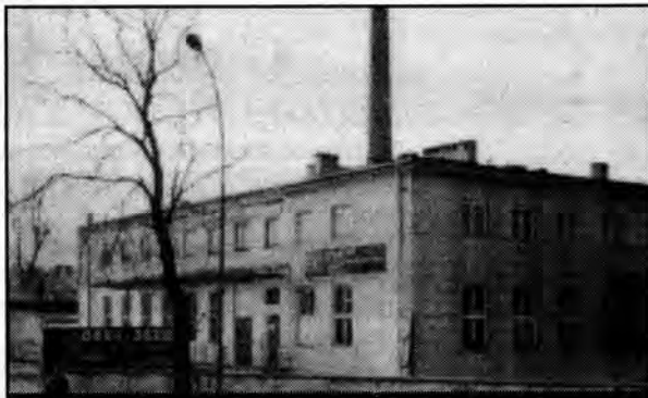
Przemysł, zaplecze magazynowo-biurowe o powierzchni ok. 1500 m kw., z dobrym dojazdem, za 950.000