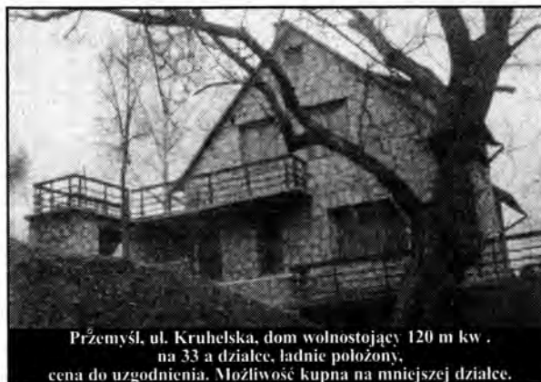
Przemysł, ul. Krubelska, dom wolnostojący 120 m kw. na 33 a działce, ładnie położony, cena do uzgodnienia. Możliwość kupna na mniejszej działce.