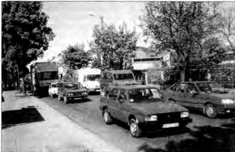
Szczególnie uciążliwa sytuacja panuje na ul. Poniatowskiego

ruchu obowiązywać będzie do końca września. Utrudnia ona życie pieszym, kierowcom i pasażerom komunikacji miejskiej. W miejscach objazdów kierowcy nagminnie łamią przepisy drogowe, a policja stosuje surowe kary.