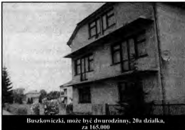
Buszkowiczki, może być dwurodzinny, 20a działka, za 165.000