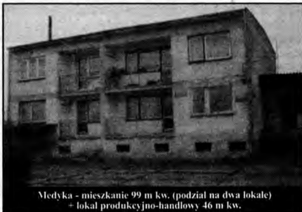
Medyka - mieszkanie 99 m kw. (podział na dwa lokale) + lokal produkcyjno-handlowy 46 m kw.