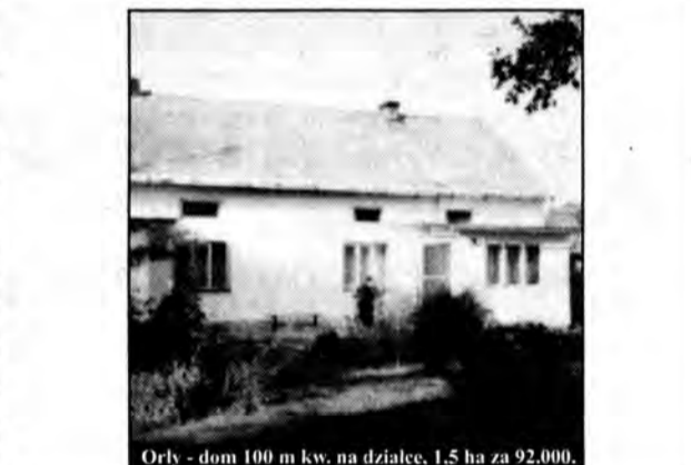
Orly - dom 100 m kw. na działce 1,5 ha za 92.000.