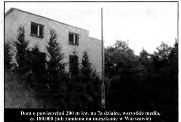
Dom o powierzchni 200 m kw. na 7a działce, wszystkie media, za 180.000 (lub zamiana na mieszkanie w Warszawie)

Przemyśl, ul. Puszkińska, 100 m kw., w domu jednorodzinnym, po remoncie za 115.000*, Przemyśl, os. Rycerskie, 86 m kw., 4 pokoje + garaż za 112.000*, Przemyśl, ul. B. Spiechowicza, 44 m kw., dwa pokoje za 75.000*, Przemyśl - Kmiecie 57 m kw., I piętro, 4 pokoje za 71.000*, ul. Franciszkańska I p. 84 m kw., za 67.000*, Centrum 110 m kw. III p., za 97.000, możliwość zamiany na dwa mniejsze*, ul. Glazera, kawalerka IV p. 34 m kw., za 48.000*, Wynajem: mieszkanie, Lwowska 45 m kw., I piętro*, Kmiecie - 60 m kw. za 73.000*.