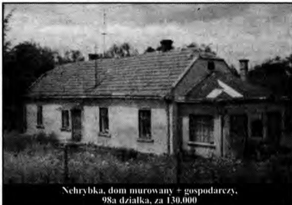
Nehrybka, dom murywany + gospodarczy, 98a działka, za 130.000