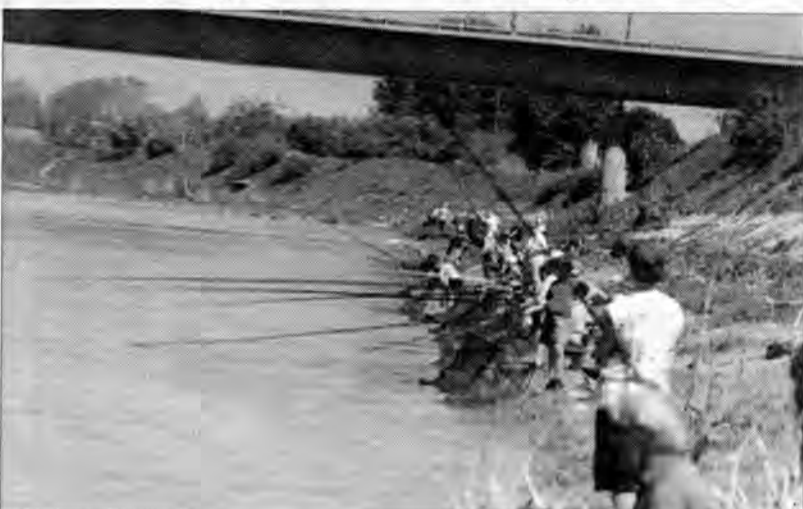
Wokół zima i jej "uroki", a my na rozgrzewkę proponujemy wiosenno-letni już program (widzieliśmy też amatorów moczenia kija pod lodem).