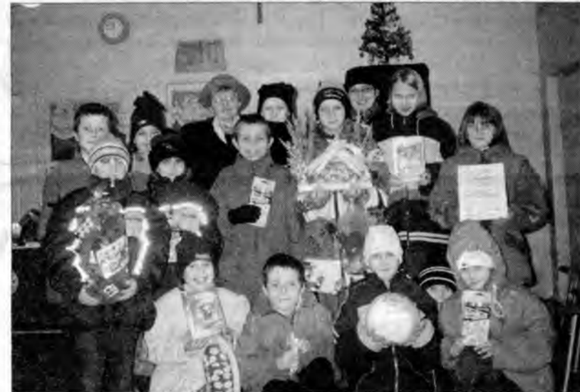
I miejsce zajęły dzieci ze świetlicy "Wzrastanie"