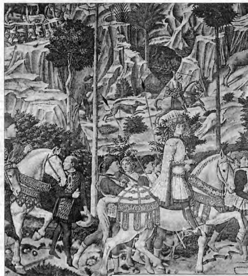
Benozzo Gozzoli, Podróż mędrców ze Wschodu (fragment).

upowszechnił się zwyczaj poświęcania złota i kadzidła, a od XVIII wieku - także kredy. Poświęconym kadzidłem okadzano domy, zaś w Polsce (podobnie jak i w innych krajach) poświęconą kredą znaczą się drzwi wejściowe, pisząc pierwsze litery tradycyjnych imion mędrców oraz datę nowego roku (w tym roku: K+M+B 2002). Kościelne szopki wzbogacają się o figu-