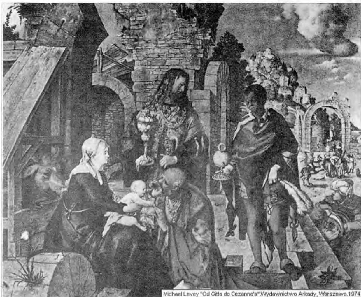
Michael Levey "Od Gitta do Cezanne'a". Wydawnictwo Arkady, Warszawa, 1974