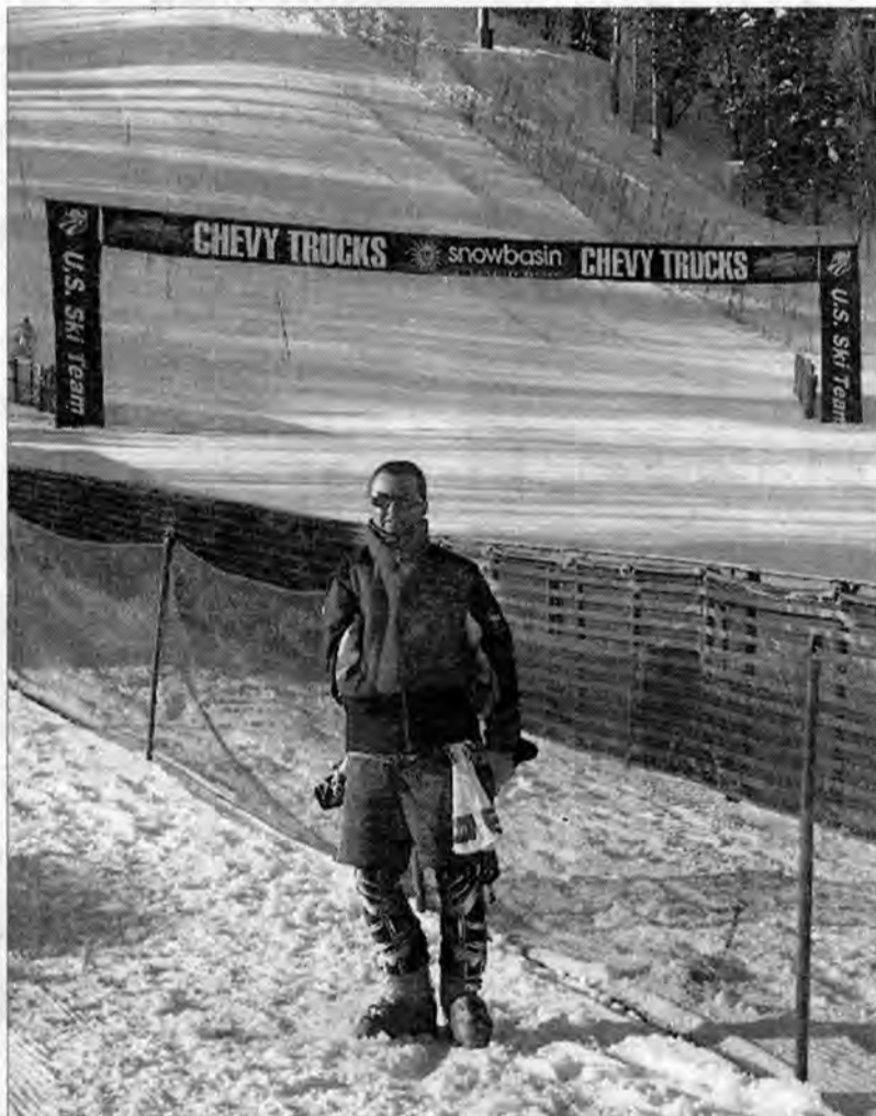
Na mecie trasy w Salt Lake City.