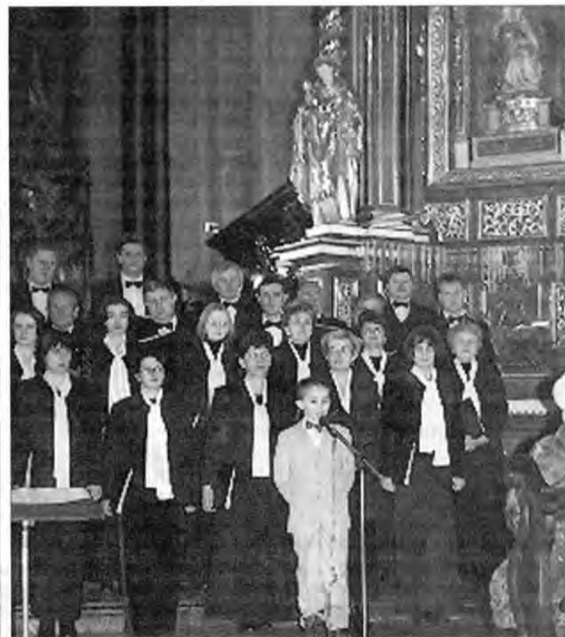
Archidiecezjalny Chór "Magnificat"

W niedzielę 6 stycznia w Przemysku, przy kościołach i podczas charytatywnych występów, już po raz drugi, kwestowano na karetkę "Dzieciątka Jezus" dla tutejszego Szpitala Wojewódzkiego.