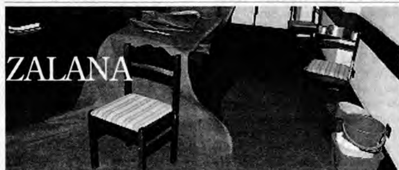
Po obfitych śniegach we znaki daje się odwilż. W ubiegłym tygodniu niespodziewany deszcz spowodował zamoknięcie sali urzędu wojewódzkiego, którą dierżawi przemyskie starostwo.

Fundacja POLSKI KOMITET ZWALCZANIA RAKA ; Oddz. Podkarpacki w Przemyślu