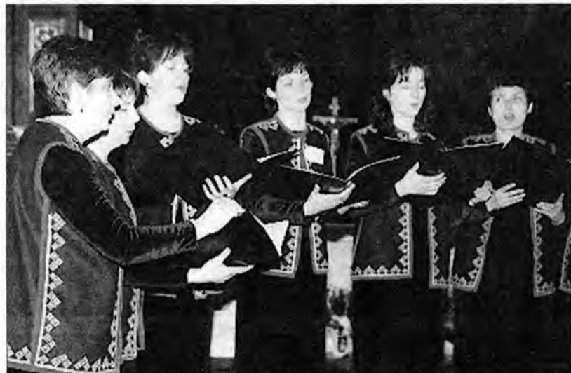
Przemyśl reprezentowały chóry: „Namysto”...

W trakcie festiwalu dominowały kolędy i pastoralki, których można było wysłuchać w wielu językach. Uczestnicy festiwalu zebraли się ponadto na spotkaniu oplatkowym, podczas którego mieli okazję do rozmów i wymiany doświadczeń. Organizatorami pierwszej edycji imprezy (miejmy nadzieję, że pozostanie ona na długo w przemyskim kalendarzu kulturalnym) był Wydział Kultury i Sportu Urzędu Miejskiego oraz Chór Archidiecezjalny „Magnificat”. Finansowo wsparły organizatorów Fundacja Karpacka - Polska oraz Fundacja Współpracy Polsko-Niemieckiej. (lew)