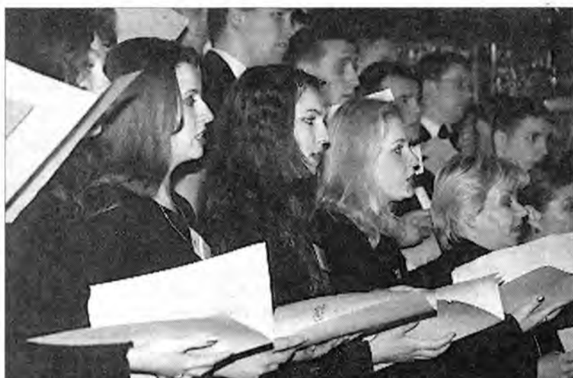
Chór katedry rzymskokatolickiej z Łucka zaśpiewał m.in. „Cichą noc” w kilku językach