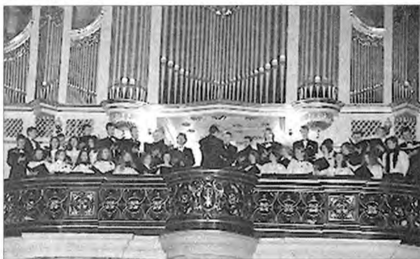
„Stabat Mater” w wykonaniu chóru „Ave Vitae” z Wileńskiego Uniwersytetu Pedagogicznego

Przez dwa weekendowe dni Przemyśl gościł uczestników I Międzynarodowego Festiwalu Chórów: Kolędy i Pastoralki Różnych Narodów”. W sobotę 9 chórów zaprezentowało się w bazylice archikatedralnej, zaś w niedzielę – przemyslanie mogli wysłuchać ich śpiewu w różnych kościołach miasta.