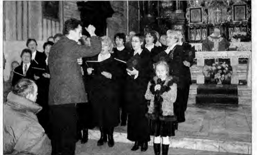
Chór "Jarosław" podczas koncertu kołęd w jarosławskim kościele oo. Dominikanów

Czas kolędowania jest pracowity dla różnego rodzaju chórów i zespołów, również dla Reprezentacyjnego Chóru Mieszanego "Jarosław".