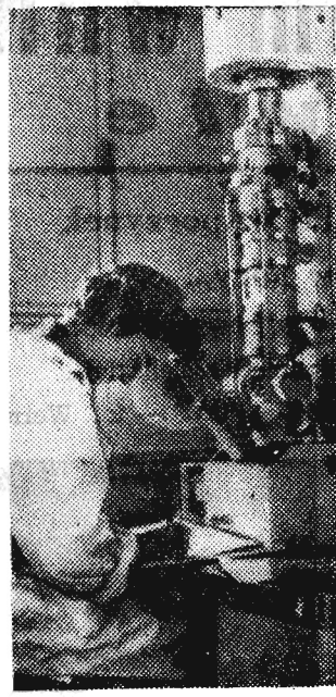
W Laboratorium Atomowym Instytutu Badawczego w Lublanie.