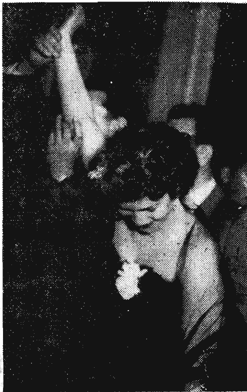
Zgłaszanie kandydatek na Miss Bału...

Wybaczcie, drodzy Czytelnicy, że naszą informację rozpoczynamy od niezaplanowanego, ale pokrywającego się mimo wszystko z prawdą samochwalstwa: udał się nam (tj. Stowarzyszeniu Dzien- nikarzy) tegoroczny Bal Prasy. Przy czwartej z kolei imprezie mieliśmy już sporo doświadczeń i więcej niż w latach ubiegłych - inwencji. W następnym roku sprawozdanie z balu pisać będą sami jego uczestnicy. W roku bieżącym zamiaru tego zanie- chaliśmy ze względu na wybitnie beztrojskie humory, które nie pozwoliły nakłonić rozbawionych gości do napisania poważnego sprarozdania. Stąd tylko szczegóły: