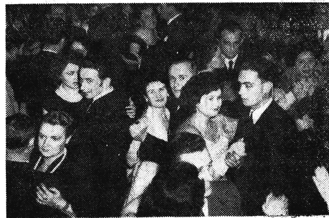
Było tłoczno, ale w miarę.

ZAKONCZENIE BALU - już w dniu następnym z rana ze względu na konieczność powrotu do rodzinnych pieleszy przed sygnatem czasu i hejnałem z Krakowa. (bos)