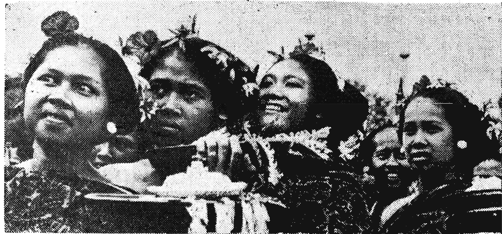
Tancerki z wyspy Bali (Indonezja) słyną z urody...