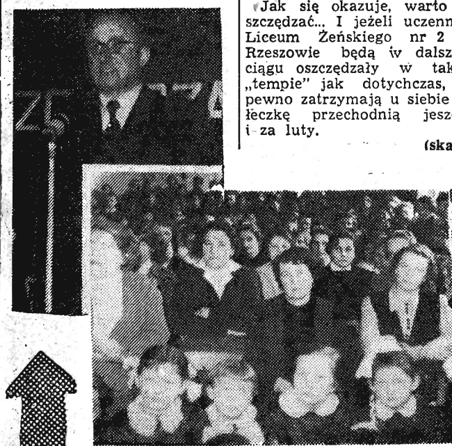
Do zebranych przemawia dyrektor szkoły ob. Tyski.