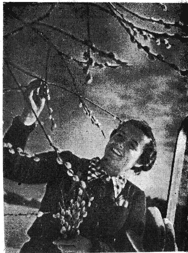
Zima nie jest już groźna. Wprawdzie mroźny wiaterek usiłuje straszyć, od czasu do czasu sypie śnieżek ale srebrne bazyce nastroją wiosennie.