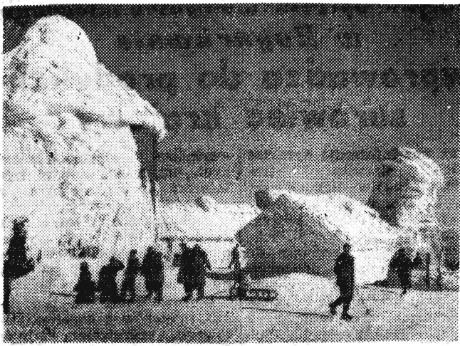
Na zdjęciu: Te dziwne „budowle lodowe” — to autentyczne schroniska na „Śnieżce” — całkowicie pokryte szronem...