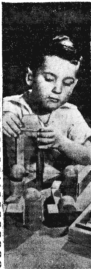
W tym domku, który ja wybuduję na pewno będzie strych, na którym mamusia będzie mogła suszyć bieleznię.