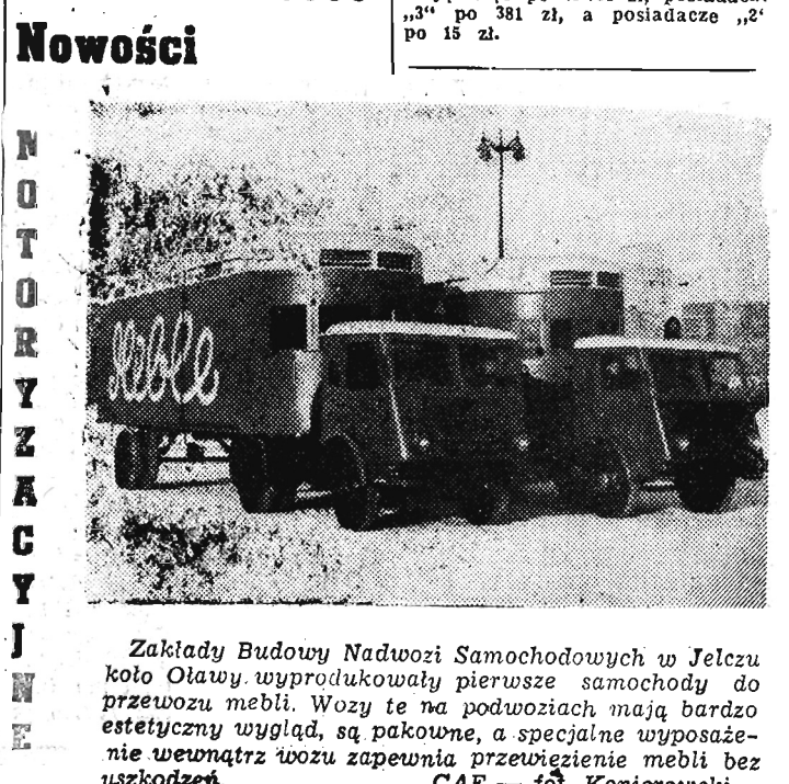
Zakłady Budowy Nadwozi Samochodowych w Jelczu koło Olawy wyprodukowały pierwsze samochody do przewozu mebli. Wozy te na podwoziach mają bardzo estetyczny wygląd, są pakowne, a specjalne wyposażenie wewnątrz wozu zapewnia przewiezienie mebli bez uszkodzeń.

DELHI (PAP). W mieście Pathankot w Indiach wycołał w powietrze pociąg, wiozący amunicję przeznaczoną dla oddziałów wojskowych w Kaszmirze. Według oficjalnych danych, 25 osób poniosło śmierć, a 18 odniosło rany. Wybuch nastąpił w momencie, kiedy amunicja zaczęła prze-