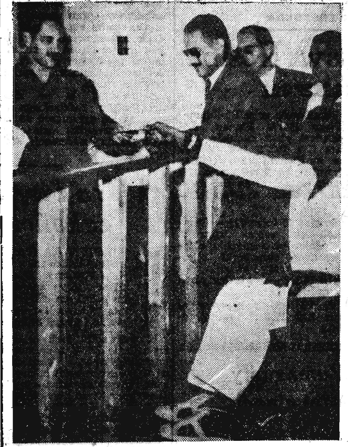
Ludność Egiptu i Syrii wypowiedziała się w plebiscycie za utworzeniem Zjednoczonej Republiki Arabskiej. Na zdjęciu: * Kair. Inwalida składa swój głos w plebiscycie.