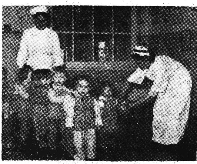
Do codziennego programu dnia dla najstarszej grupy dzieci należą oczywiście zabawy.

Program III na fal 316 m 4.37-12.20 Transmisja z pr. II 12.20-15.05 Transmisja z pr. II 15.05-20.45 Transmisja z pr. II