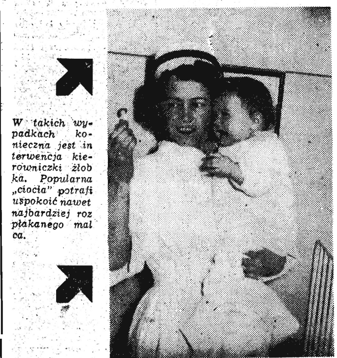
W takich wypadkach konieczna jest interwencja kierowniczk żłobka. Popularna „ciocia” potrafi uspokoić nawet najbardziej rozpiakanego malucha.

Kiedy odwiedziłyśmy żłobek nr 2 - Prezydium MRN w Rzeszowie, mieszczący się przy ul. Staszica - okazało się, że właśnie w lutym upłynął rok od jego otwarcia. Żłobek jest nowoczesny, przystosowany w najdrobniejszych szczegółach do potrzeb swych wychowanków.