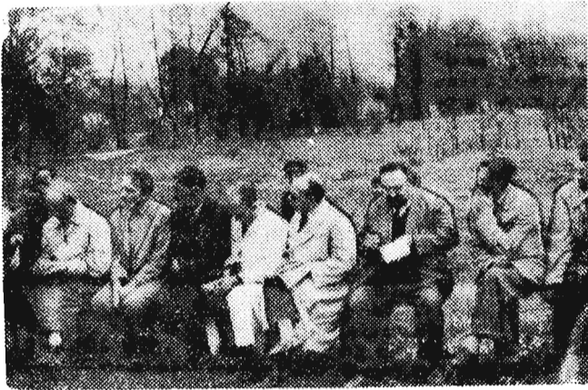
Na zdjęciu: Komisja Wydziału Zdrowia obraduje nad możliwościami jednego z najbogatszych uzdrowisk naszego kraju

wody te, jak również bogate złoża borowinowe mają bardzo wysoką wartość leczniczą. Miejscowy aktyw znając świetność Horyńca sprzed lat, sygnałizował o potrzebie jego odbudowy. Przyjeżdżało wiele komisji. Wszystkie przyznawały rację, że trzeba uzdrowisko odbudować, obiecały, że się tym zajmą, ale na tym się kończyło.