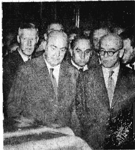
Na zdjęciu: Przy polskich maszynach w pawilonie przemysłu ciężkiego.