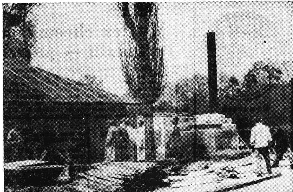
Na zdjęciu: Odbudowa łazienek.

Spółdzielnia chce przejąć pałac po rozwiązaniu zespołu PGR, który potrzebny jest na urządze-