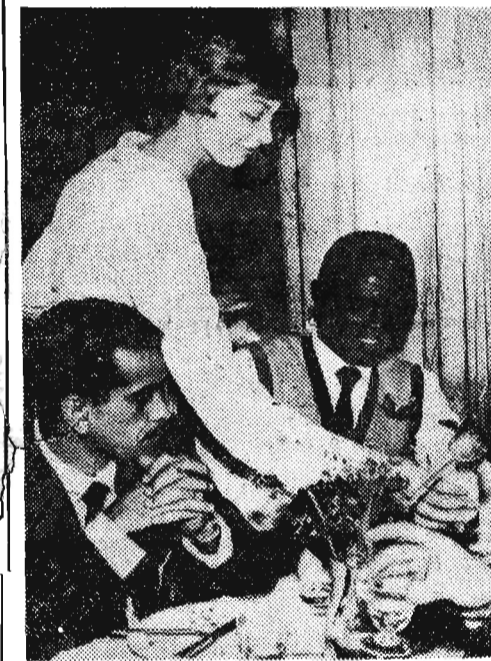
PRZED PIŁKARSKIMI MISTRZOSTWAMI ŚWIATA W SZWECJI

Eisenhower proponuje, aby rozmowy ekspertów rozpoczęły się 1 lipca lub w pierwszych dniach tego miesiąca w Genewie.