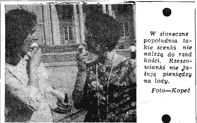
W słoneczne popołudnia takie scenki nie należą do rzadkości. Rzeszowiarki nie żałują pieniędzy na lody.

Równocześnie zwrócono się do innych przedsiębiorstw budowlanych na terenie miasta, ażeby ziemię z budów wywoziły na śmietniko przy ulicy Rejtana.