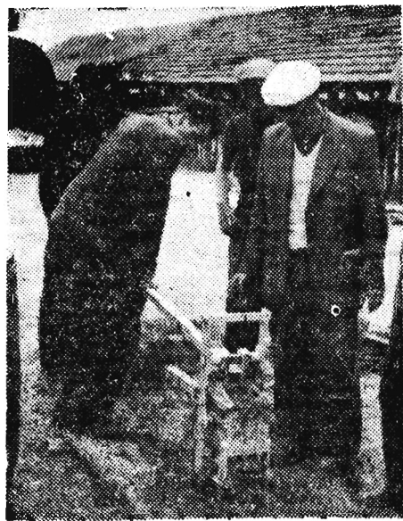
Tu trzeba własnoręcznie spróbować każdej pracy... i nawet produkować pusztaki.

Rozporządzenie Rady Ministrów z dnia 9 maja rb. przewiduje powołanie opiekunów społecznych we wszystkich wojewódzkich, powiatowych i dzielnicowych prezydium rad narodowych.