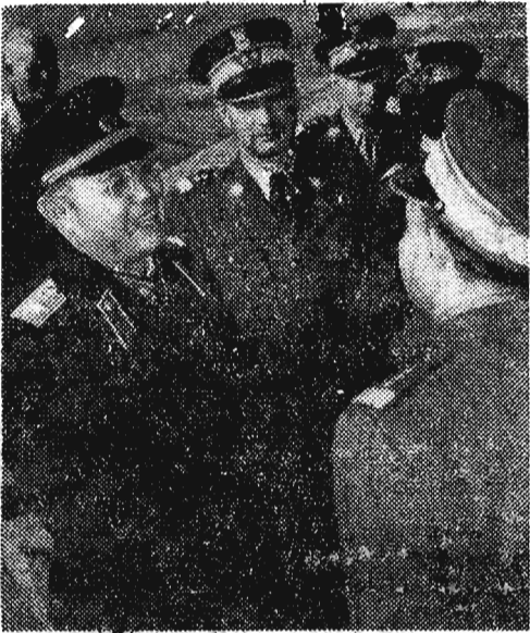
Na zdjęciu: Marszałek Związku Radzieckiego I. Koniew u ministra obrony narodowej generała broni Mariana Spychalskiego.

Do Warszawy przybyła również na uroczystości związane z obchodem XV-lecia Wojska Polskiego delegacja armii chińskiej na czele której stoi zastępca przewodniczącego Państwowego Komitetu Obrony Chińskiej Republiki Ludowej Yeh Chien-ying.