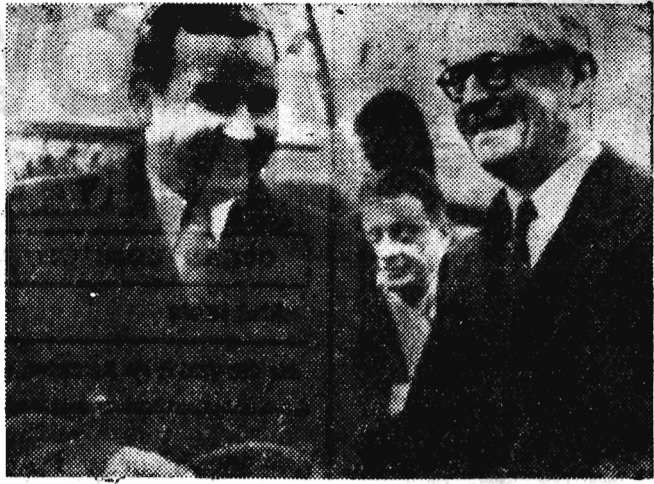
Norweski minister spraw zagranicznych H. Lange (z prawej) wita ministra spraw zagranicznych PRL A. Rapackiego po przybyciu do Oslo.

Cieszymy się, że Gruzja w wielkiej rodzinie radzieckiej jest krajem wolnym i szczęśliwym, budującym dobrobyt swych mieszkańców, wzmacniającym siłę i potęgę Związku Radzieckiego, a przez to samo siłę całego obozu socjalizmu.