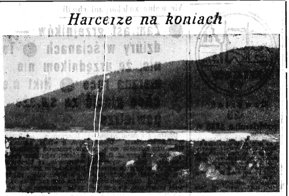
Harcerze na koniach

Przygotowania do rozpoczęcia przemysłowej produkcji tych nowych artykułów prowadzone są z inicjatywy grupy specjalistów Zarządu Handlu Owocami i Warzywami Ministerstwa Handlu Wewnętrznego przez Instytut Przemysłu Drobno i Rzemiosła. Próby zakwaszenia owoców, warzyw i ich mieszanki oraz próby sporządzenia napojów zostały już dokonane, a w połowie listopada br. przewidziane jest przeprowadzenie prób smakowych przygotowanych wyrobów. Specjalna komisja ustali listę nowych przetworów, których produkcja rozpocznie się w roku przyszłym. Zakłada się, że w 1959 roku wprowadzi się na rynek kilkanaście nowych przetworów w ilości wstępnej po 5 ton celem zbadania opinii konsumentów, po czym zostaną ustalone plany produkcji nowych wyrobów.