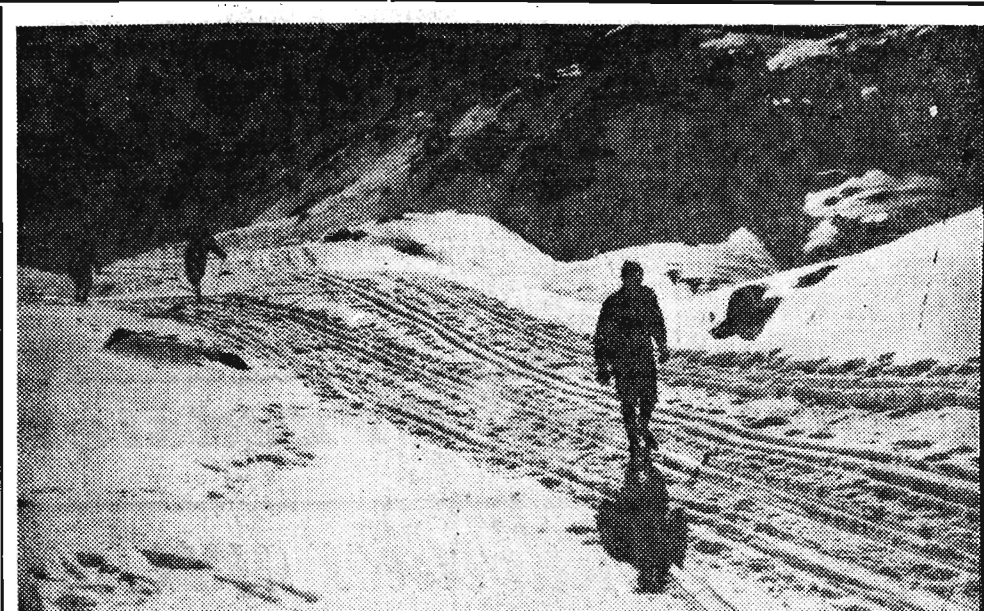
Na zdjęciu: Trening narciarzy