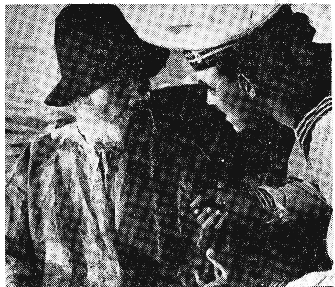
Na zdjęciu: Scena z filmu „Jaskółka”.

Dzisiaj rozpoczyna się w kinach „Apollo” i WDK w Rzeszowie oraz „Bałtyk” w Przemyślu - Przegląd Filmów Ukraińskich. Na ekranach tych kin wyświetlane będą następujące pozycje filmowe: „Pomysł pedagogiczny”, „Gwiazdy na skrzydłach” i „Stara forteca”. Są to filmy tzw. po-