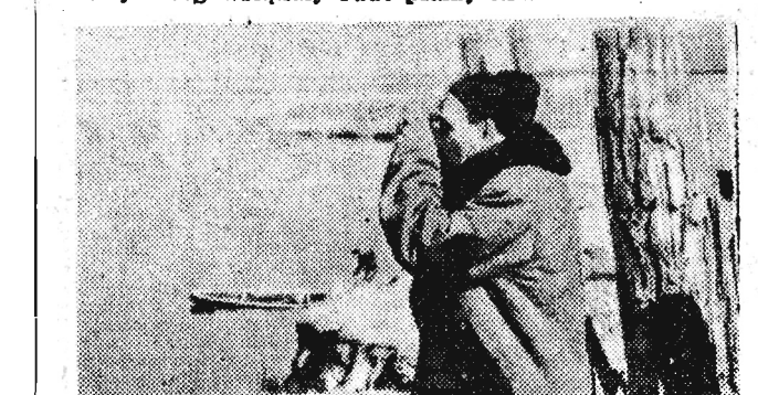
Gen. Sydor Kowpak — dowódca I UDP. Po nim dowództwo dywizji objął gen. Werszyhora.

Niemiecki cekaem rozbity pociskiem z naszego działa stanowił już tylko kupę niepotrzebnego mikro-żelazwa. Amunicyjny, który nie zdążył nawet założyć taśmy z nabojami leżał na skrzynce z amunicją z nogą dziwnie podciągniętą pod siebie. W biały śnieg wsiąkały rude plamy krwi.