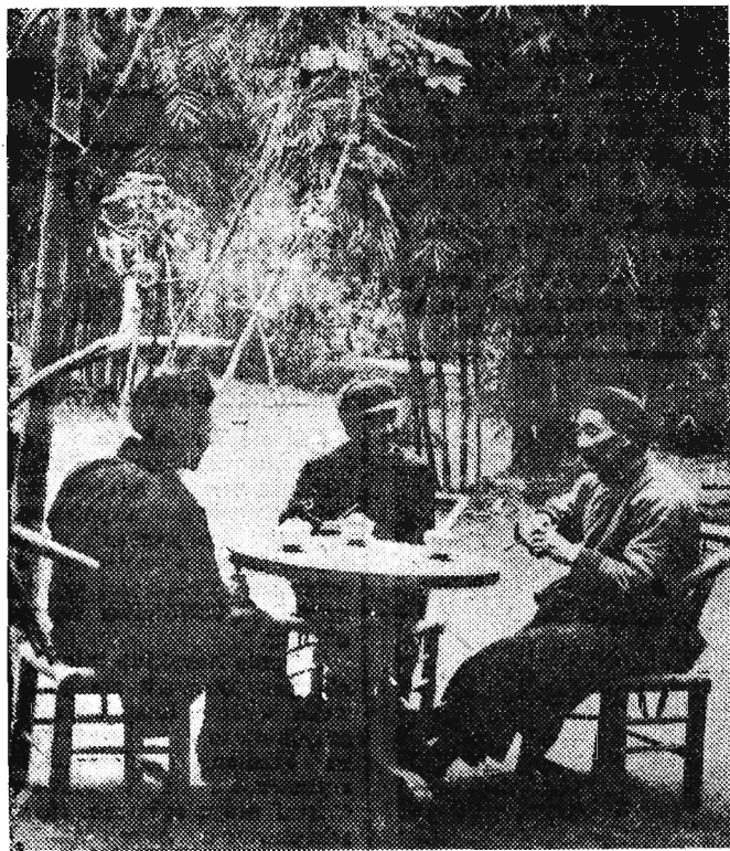
Na zdjęciu: W jednej z komun ludowych w Chińskiej Republice Ludowej.