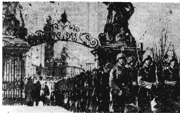
Na zdjęciu: Żołnierze hitlerowscy przechodzą przez bramę Zamku Praskiego w dniu 15 marca 1939 r.