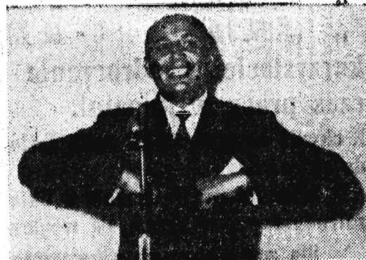
Na zdjęciu: Śpiewa Janusz Gniatkowski.