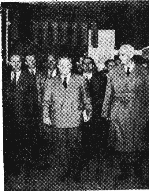
PALMIRO TOGLIATTI NA TARGACH W MEDIOLANIE

Tow. Kliszko zwiedzili także kopalnię siarki w Piasecznie, i rozmawiał z przedstawicielami dyrekcji. (s)