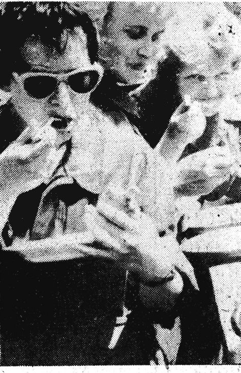
Po tylu trudach na pewno smakował wysmienity bigos z kuchni polowej. (Tekst i foto - Erski)