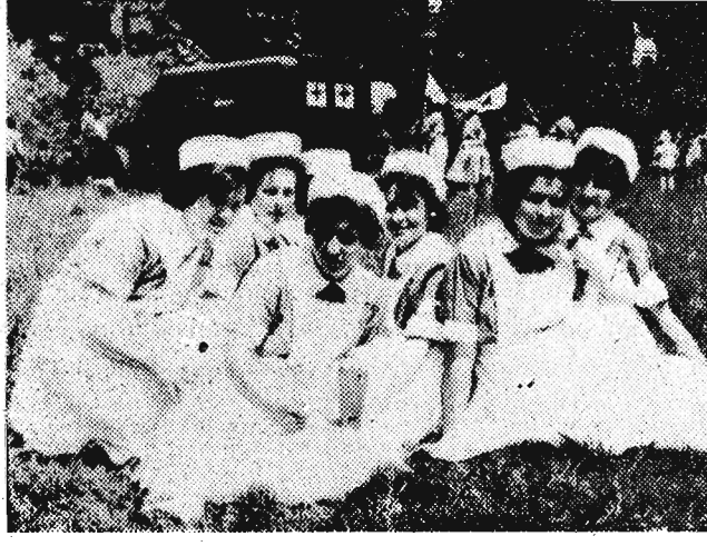
W chwili kiedy terenowe drużyny sanitarne zdawały egzamin sprawności tą miłą grupą sanitariuszek odpoczywała na zielonej trawce.

Najtrudniejszym zadaniem było chyba przenoszenie ranne go przez pelen przeszkód teren do samochodu sanitarnego.